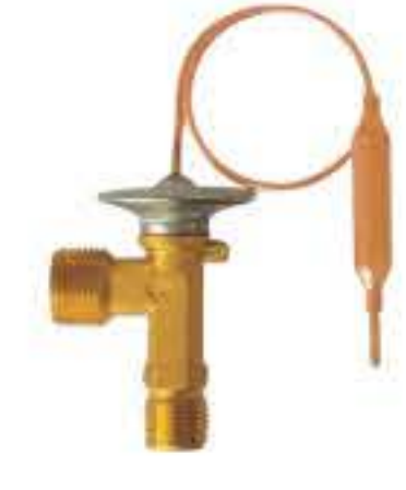
RG-58889 RCH6549 加腾挖机 KATO EXCAVATOR M-MR201955