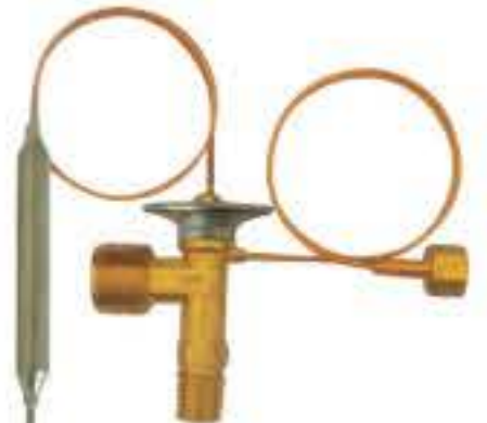
RG-58112 车型：丰田 (TOYOTA) 入口：M16X1.5 出口：M22X1.5 平衡器：M12X1.25 配件：O型 制冷量：0.5T-2.5T