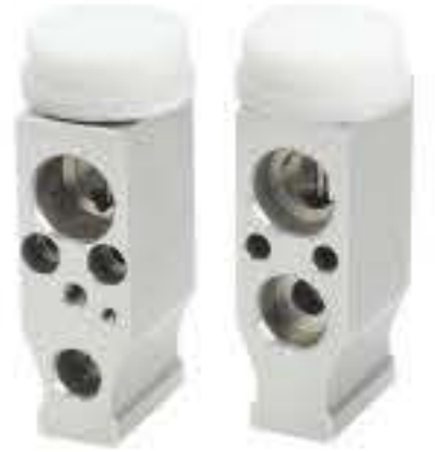
RG-58475 RCH6503 东风风行CM7前置 ALQAM40301