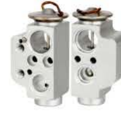
RG-58712 RCH6369 奥迪Q7 AUDI Q7 7P08200679A