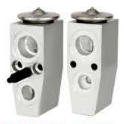
RG-58504 RCH6341 别克君越 BUICK 52494043