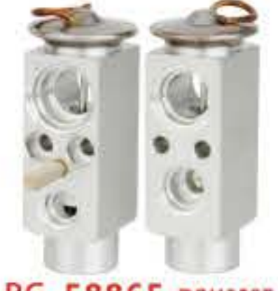
RG-58865 RCH6527 安徽华菱东风天锦 力帆520 HUALING HEAVY TRUCK 11703051