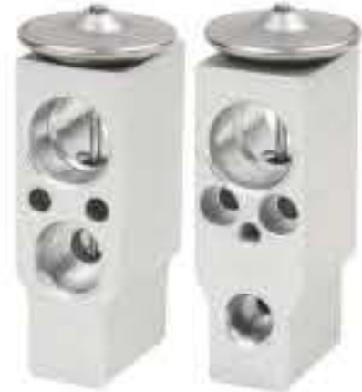
RG-58227-1 RCH6267-1 丰田凯美瑞 TOYOTA CAMRY 447500-9220