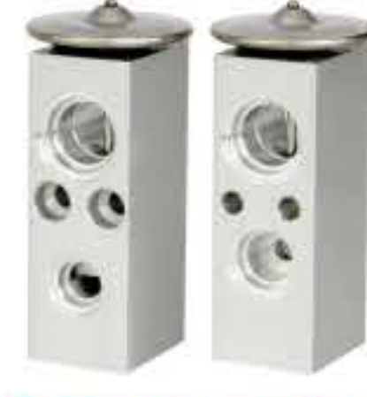
RG-58408 RCH6216 现代 HYUNDAI 97604-17001