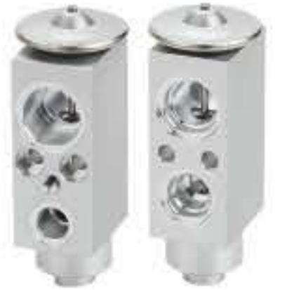
RG-58474 RCH6499 风行景逸1.5/1.8/ X3/X5/XV ALQAJ40079