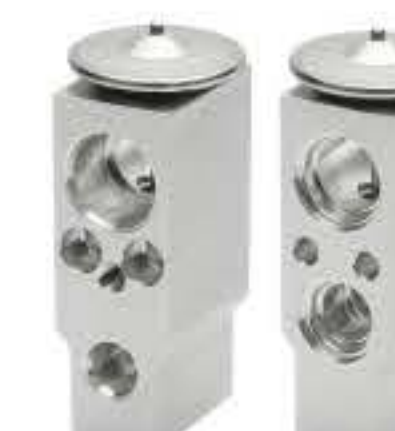
RG-58265 RCH-7027 欧蓝德 SIMBO CMA387B004 DZ NEW