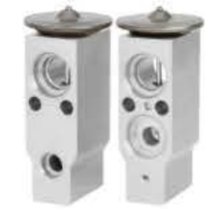
RG-58808 RCH6385 东风雪铁龙C4 CITROEN C4 72438Z16