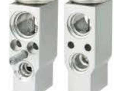
RG-58725 RCH6411 奔驰202 BENZ 202 202 830 01 84