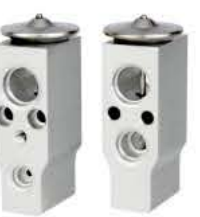
RG-58259 RCH6396 日产尼桑(菲律宾) NISSAN