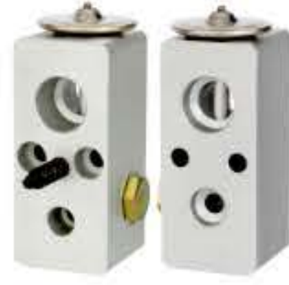
RG-58530 RCH6362 道奇 DODGE 416999