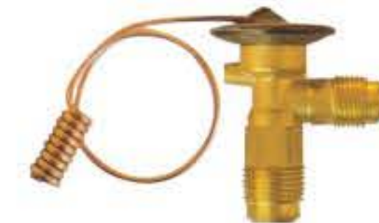
RG-58044 车型：道奇 (DODGE) 入口：3/4-16UNF 出口：5/8-18UNF 配件：F型 制冷量：0.5T-2.0T