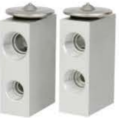
RG-58542 RCH6406 美国澳大利亚福特 USA AUSTRALIA FORD 1183Z1C1