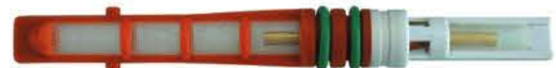
RG-68023 Color:Orange For:Ford Dia:0.059