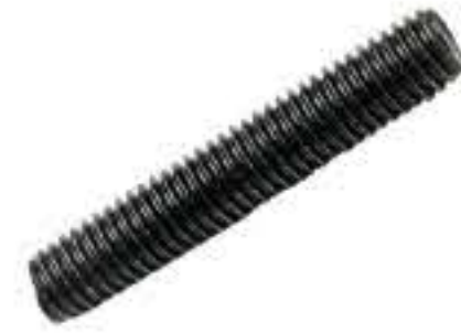
RG-3# M8*1.25 长度44MM(镀黑)