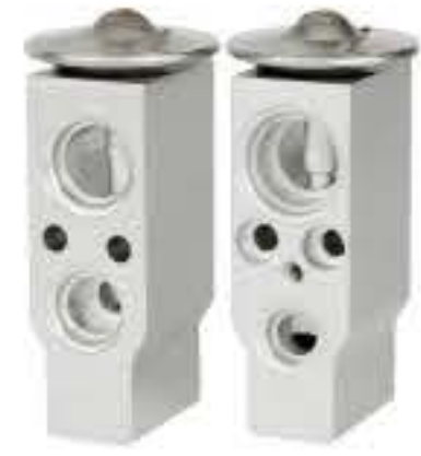
RG-58877 RCH6537 江铃凯运 JIANG LINGY F108FH9CA01