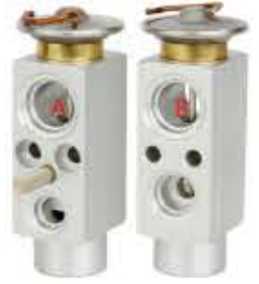
RG-58804 RCH6262 富豪货车 VOLVO TRUCK A:∅14.6 31101177 B:∅14.6