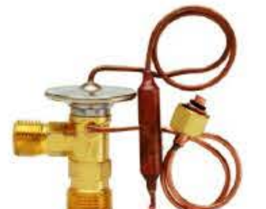
RG-58120-1 车型：尼桑 (NISSAN) 入口：M20x1.5 出口：M16x1.5 平衡器：M12X1.25 配件：O型 制冷量：0.5T-2.5T