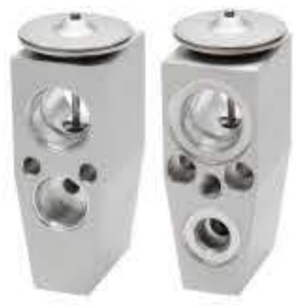
RG-58563 RCH6475 吉普指南者 JEEP AA447500-16011