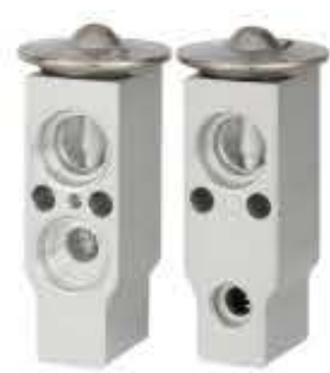
RG-58861 RCH6523 重汽豪运/奥威 HOWO TRUCK/AOWEI 447500-1440