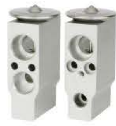
RG-58733 RCH6255 奔驰163 BENZ163 163 830 0084