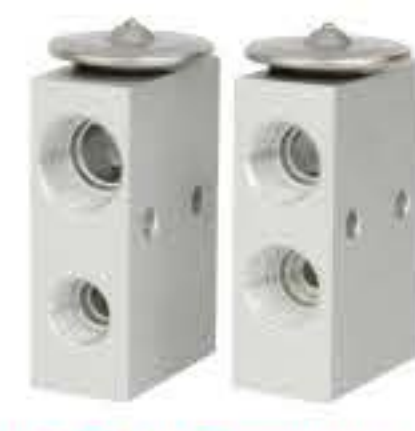
RG-58723 RCH6400 奔驰、宝马、R12 BENZ BMW R12 1238301184