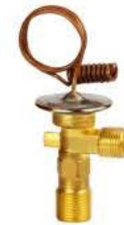
RG-58018 车型: 福特 GM,FORD,JEEP 入口: 3/4-16UNF 出口: 5/8-18UNF 配件: O型 制冷量: 0.5T-2.0T OE:G-5910590