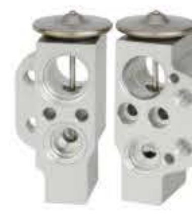
RG-58708 RCH6225 大众波罗 V.W POLO 6Q820679A