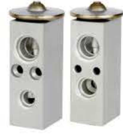
RG-58415 RCH6334 大宇、蓝龙 DAEWOO 96274639