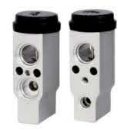
RG-58418 RCH6395 起亚嘉华2.7L KIA 2.7L 1K53C61J12C