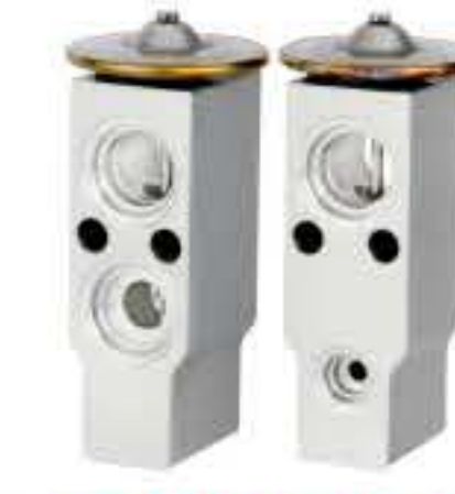
RG-58453 RCH6337 老款小红旗 MINI HONGQI Iw0162173