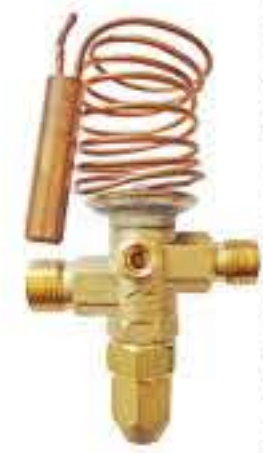
RG-5900 制冷剂：R134A 入口：5/8UNF 出口：3/4UNF 外平衡：7/16UNF 阀芯规格：4.5 /直通结构 名义制冷量：11.8Kw 蒸发温度范围：-30℃~+15℃