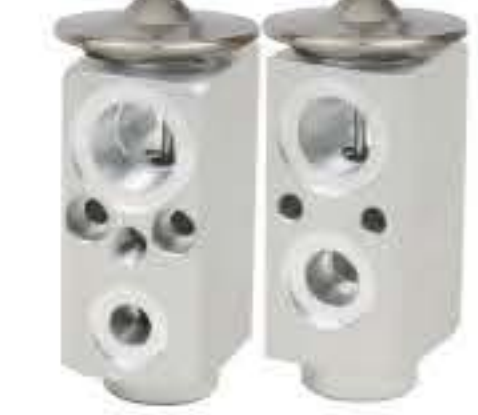
RG-58548-1 RCH-6415-1 彼得比特 1000352807 NEW