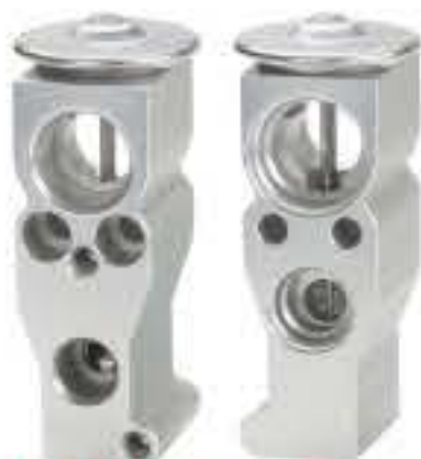
RG-58893 RCH6553 新款天龙/贝洱 DONGFENG KINLAND -NEW/ BEHR EC455003