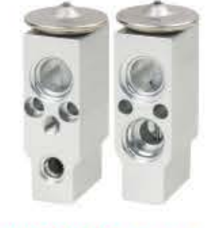
RG-58458 RCH6435 沈阳金杯前套 JINBEI 1602289H