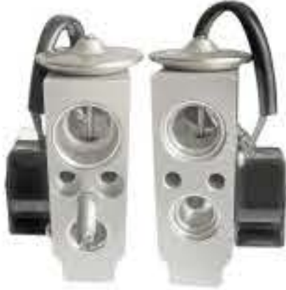
RG-58479 RCH7001 荣威(新款)550油电混合 7033247