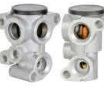
RG-58537 RCH6365 土星 SATURN S-25030587