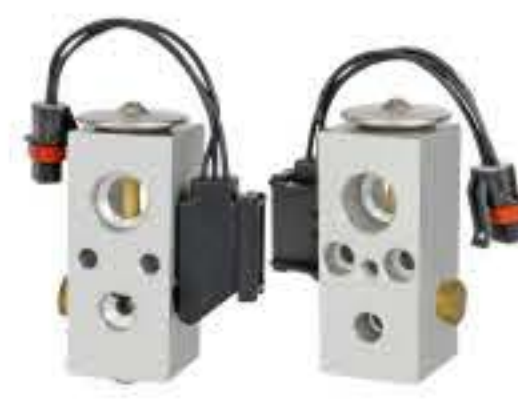
RG-58531 RCH6363 道奇 DODGE 4677334