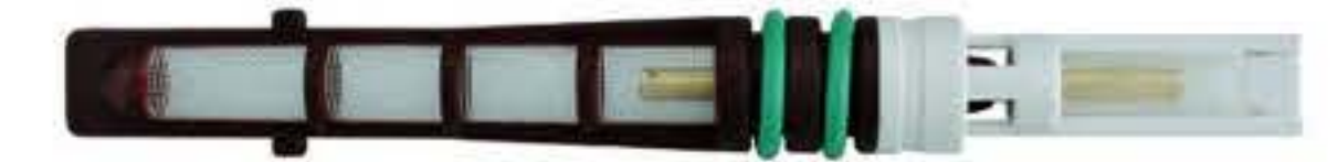
RG-68004 Color:Black Evaporator Dia: 0.062