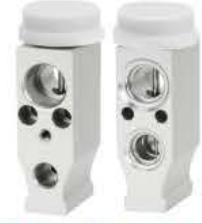
RG-58470 RCH6490 奇瑞E5/瑞麒G3 CHERY E5 A15-8106010FC