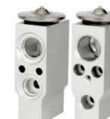
RG-58902 RCH6562 华菱汉马 CAMC P06H083000