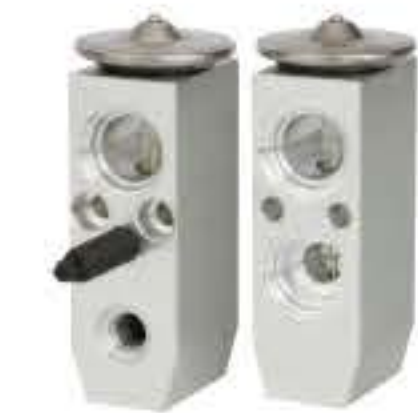
RG-58505 RCH6390 雪佛兰、乐驰 CHEVROLET AVEO 92205880