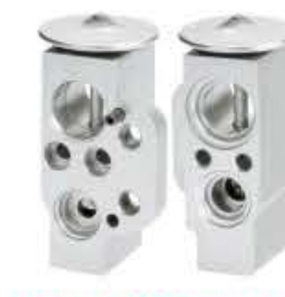
RG-58745 RCH6460 大众高尔夫 V.W GOL 1K 0820 676H