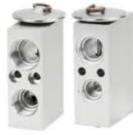
RG-58566 RCH6488 美国雪佛兰 AMERICAN CHEVROLET 52477944