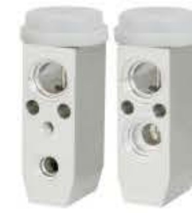
RG-58857 RCH6514 现代225-7挖机 HYUNDAI 225-7 F108-JD6AA-03