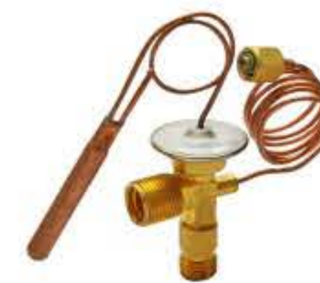
RG-58117 车型： 入口：3/4-16UNF 出口：M16X1.5 平衡器：M12X1.25 配件：O型 制冷量：0.5T-2.5T