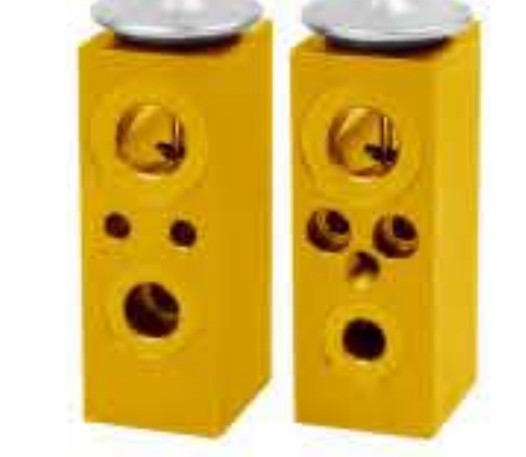
RG-58552-1 RCH6417-1 福莱纳 FREIGHTLINER P-B0B93674