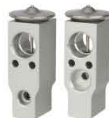
RG-58205 RCH6204 丰田花冠 TOYOTA COROLLA 447500-9081