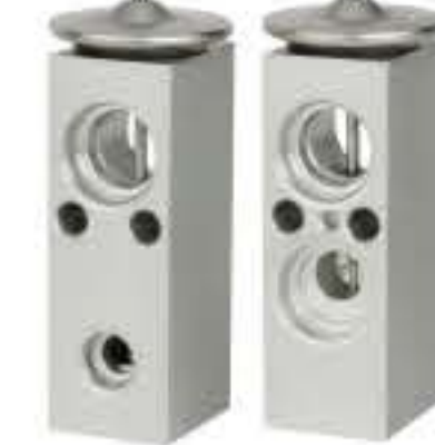
RG-58220 RCH6240 丰田R134a(三菱V31) TOYOTA R134a 447500-0031