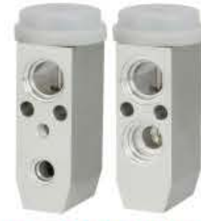
RG-58407 RCH6281 现代御翔 HYUNDAI 976263C010