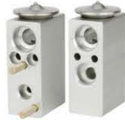
RG-58801 RCH6246 菲亚特 FIAT F-46723617