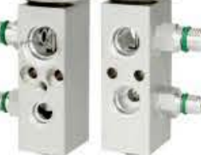
RG-58538-1 RCH-6388-1 肯沃斯 KENWORTH 540057B5M NEW