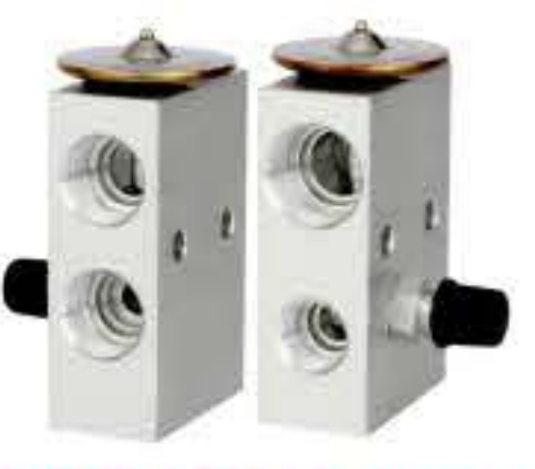
RG-58546-1 RCH6373-1 肯沃斯 KENWORTH 1676665C1