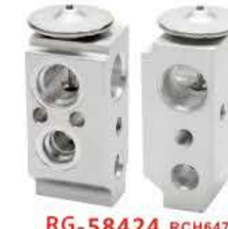
RG-58424 RCH6478 进口现代/雅绅特 02-05 1.6L HYUNDAI/ACCENT 21910