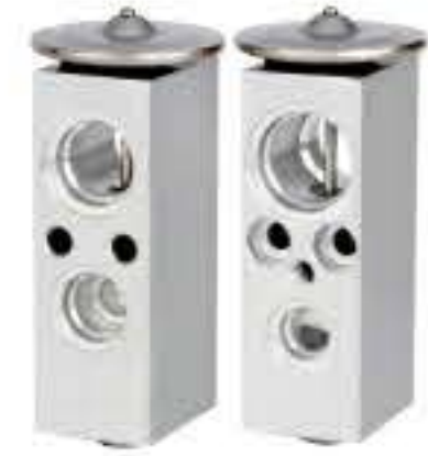
RG-58807 RCH6392 新富康 NEW CITROEN 651362UH