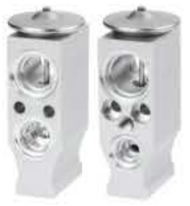
RG-58883 RCH6543 联合重卡 JOINT HEAVY TRUCK K70601