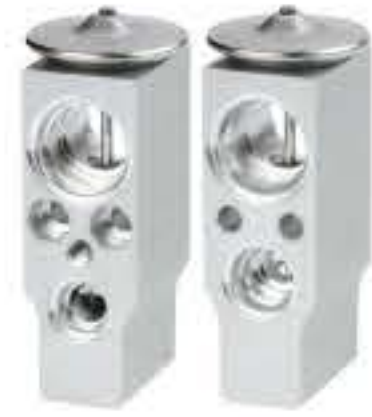
RG-58879 RCH6539 豪沃T5G HOWO A7 712W61942