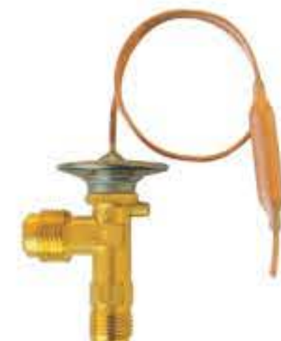
RG-58009 车型: 丰田 (TOYOTA) 入口: 5/8-18UNF 出口: 3/4-16UNF 配件: F型 制冷量: 0.5T-2.0T