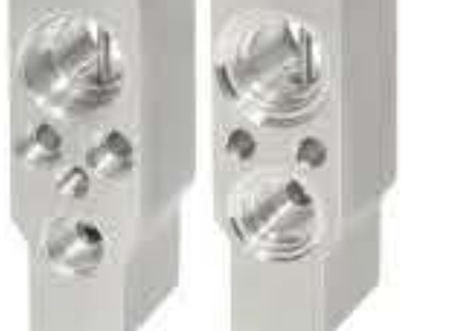
RG-58558 RCH6449 新款赛欧 NEW CHEVROLET AVEO 16460320