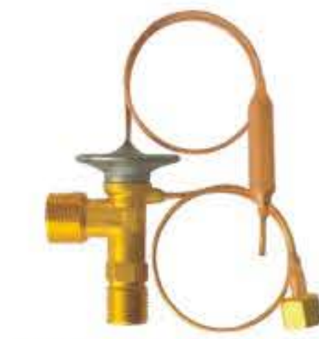
RG-58103 车型：丰田 (TOYOTA)/东南菱帅 入口：9/16-18UNF(φ8.6) 出口：3/4-18UNF(φ13.1) 平衡器：7/16-20UNF 配件：O型 制冷量：0.5T-2.5T