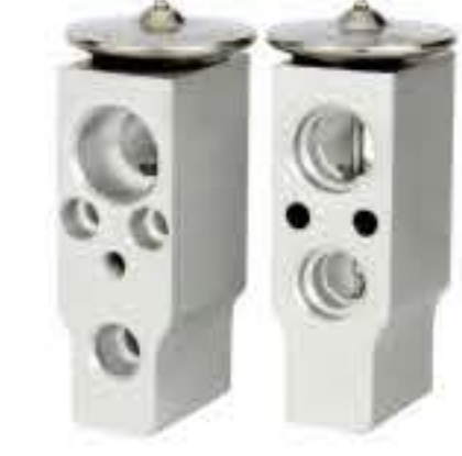
RG-58535 RCH6346 欧宝 OPEL 25997316F