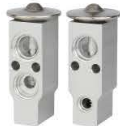
RG-58864 RCH6526 大宇挖机 DAEWOO 88515-33010