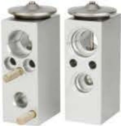
RG-58805 RCH6370 雷诺 RENAULT 7013346