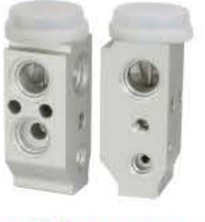
RG-58413 RCH6289 现代途胜 HYUNDAI TUCSON 97626-2E100