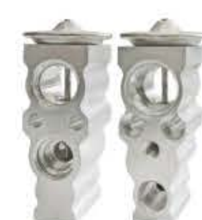
RG-58263 RCH7012 斯巴鲁 SUBARU、翼豹G13/G23 73531FJ010