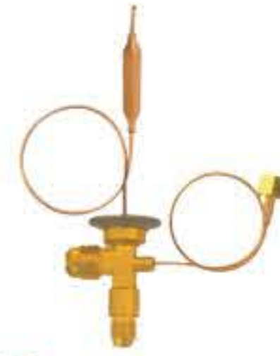
RG-58125 车型: 入口: 5/8-18UNF 出口: 3/4-16UNF 平衡器: 7/16-20UNF 配件: F型 制冷量: 0.5T-2.5T