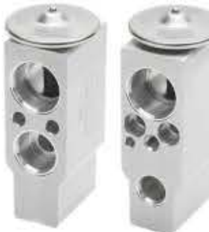
RG-58490 RCH-7030 新款华晨金杯前置 1534N519515043 NEW