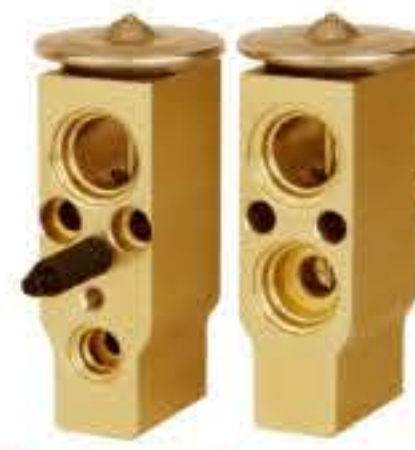
RG-58403 RCH6248-1 现代雅绅特 HYUNDAI ACCENT 97604-1C100