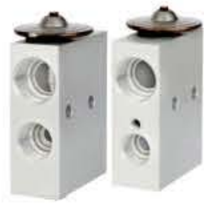
RG-58896 RCH6556 陕汽德龙老款M3000 Delong 50051BH