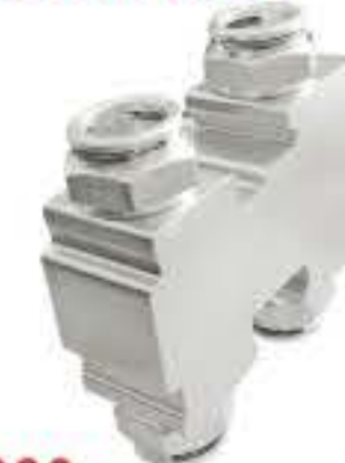
RG-10000 新君威1.6T、迈锐宝1.6T 92219753