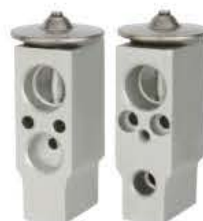
RG-58233 RCH6335 本田 HONDA 447500-1770