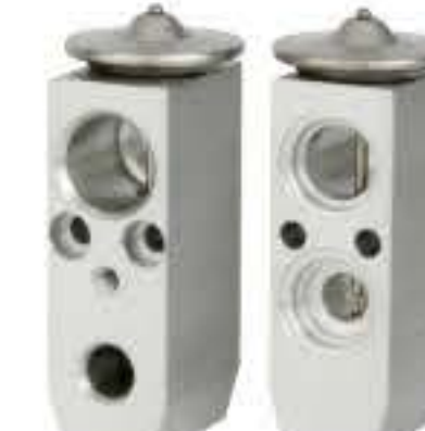
RG-58212 RCH6212 日产铃木/维特拉 NISSAN SUZUKI 503714-1550