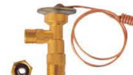
RG-58019 车型: 入口: 3/4-16UNF 出口: 5/8-18UNF 配件: O型 制冷量: 0.5T-2.0T