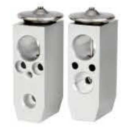
RG-58742 RCH6331 大众T4/欧力威 V.W T4