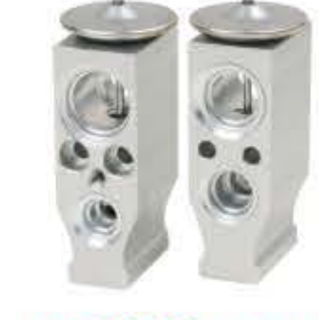
RG-58456 RCH6421 依维柯 宝迪后置 IVECO 51515-A0470