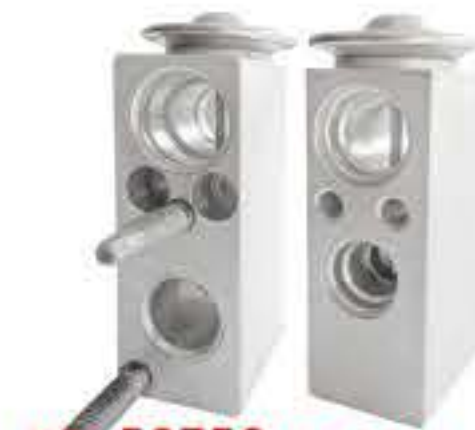
RG-58758 RCH7015 奔驰新款W166/ML350/ML300/ GL320/GL350/GL450 BENZ A1668300284