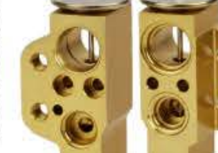
RG-58750 RCH6481 泰国大众保时捷 V.W PORSCHE 7L0820712