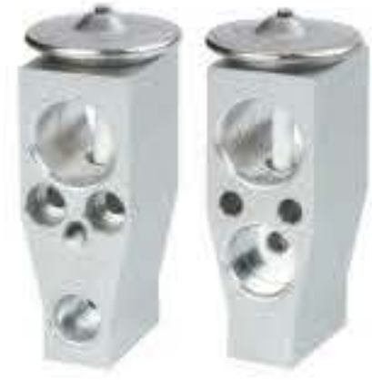
RG-58881 RCH6541 日野300 HINO 300 447500-4050