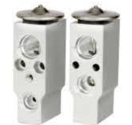
RG-58508 RCH6347 福特/林肯 FORD 861219849A