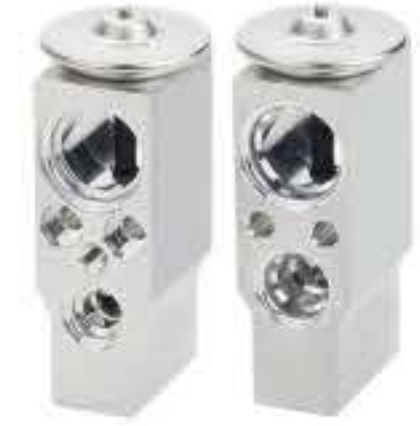
RG-58574 RCH6509 欧宝麦瑞纳 OPEL MERIVA U39400001