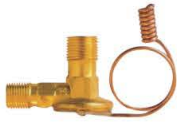
RG-58002 车型: 马自达 (MAZDA) R12 入口: 5/8-18UNF 出口: 3/4-16UNF 配件: O型 制冷量: 0.5T-2.0T