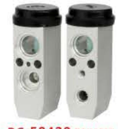
RG-58420 RCH6376 起亚远舰 KIA OPTIMA 97626-3E200