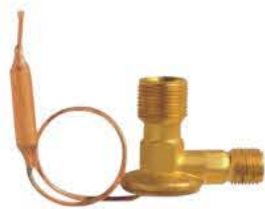
RG-58006 车型: 本田 (HONDA) 入口: M16x1.5 出口: M20x1.5 配件: O型 制冷量: 0.5T-2.0T