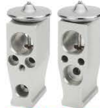
RG-58472 RCH6495 比亚迪新F3/秦/唐/宋/元/ S7.S6.G5 F3-8106100