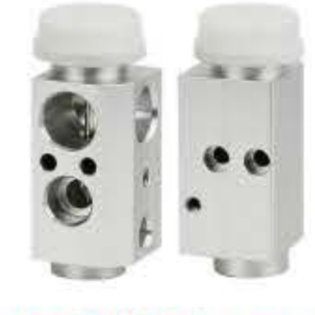
RG-58454-1 RCH6416-1 众泰T600/X5 ZHONGTAI T600/X5 81070200002-B11