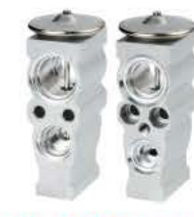
RG-58744 RCH6442 大众新桑塔纳 NEW SANTANA L34D820679