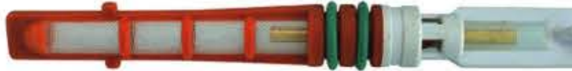
RG-68018 Color:Orange T-top For:Chrysler Dia:0.057