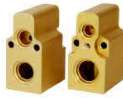
RG-58724 RCH6217 捷达王 JETTA A-6N0820679A