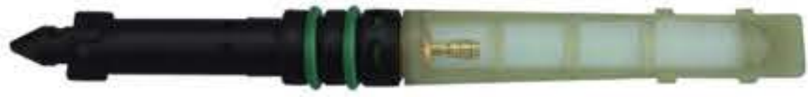
RG-68017 Whit Condenser