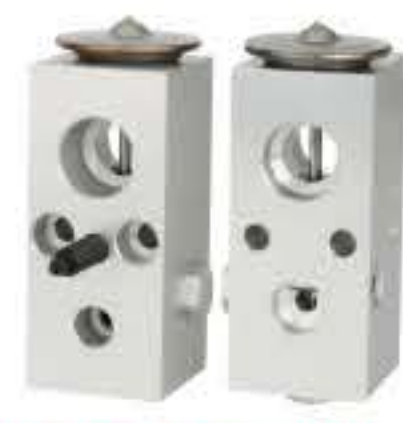
RG-58526 RCH6314 道奇 DODGE E2240308ZC