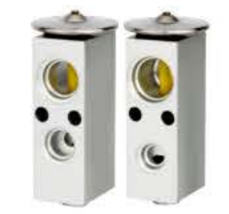
RG-58729 RCH6405 斯堪尼亚 SCANIA 1342237