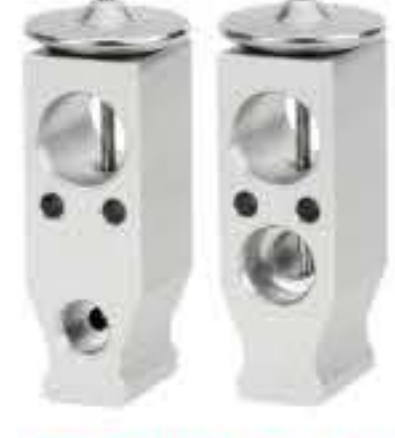
RG-58471 RCH6491 荣威550/750 RONGWEI 550/750 JQD90001A