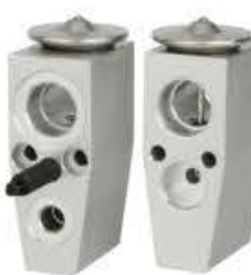
RG-58218 RCH6237 五十铃 I-350/370 ISUZU I-350/370 447500-2961