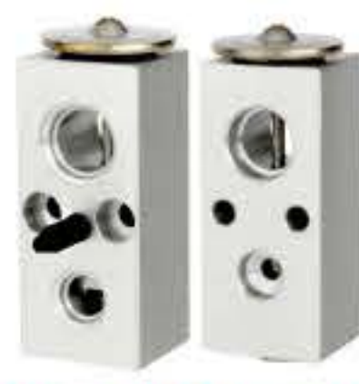
RG-58524 RCH6232 克莱斯勒 CHRYSLER 550560252AE