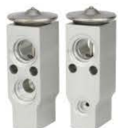
RG-58241 RCH6394 丰田 R12 TOYOTA 047500-9072