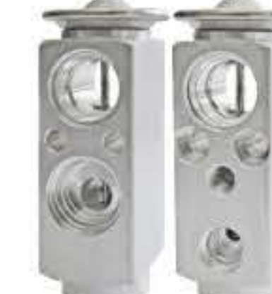
RG-58907 RCH6567 江铃N800 JMC N800 ELN3-19849-AA