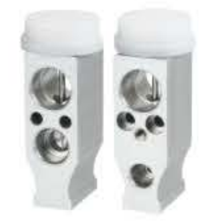
RG-58463 RCH6458 一汽森雅 FAW XENIA 7C1919849BA