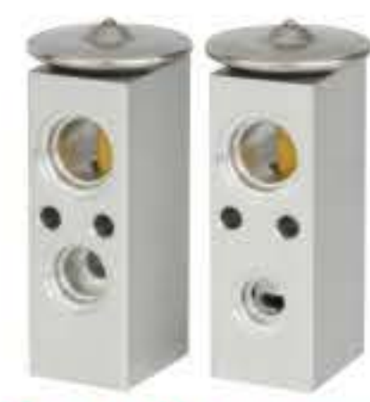
RG-58401 RCH6236 大宇、旅行家 DAEWOO 96387210