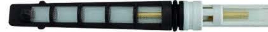
RG-68001 Color:Grey For:Toyota Dia: 0.072