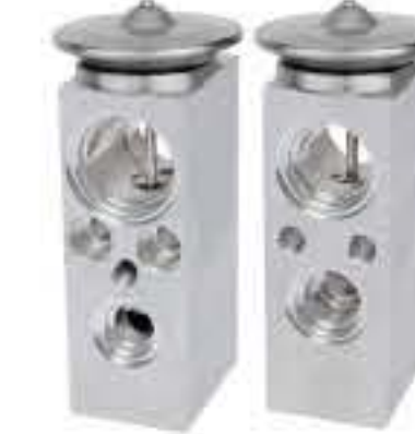
RG-58705-1 RCH6315-1 梅赛德斯W201 MERCEDES W201 2018300784