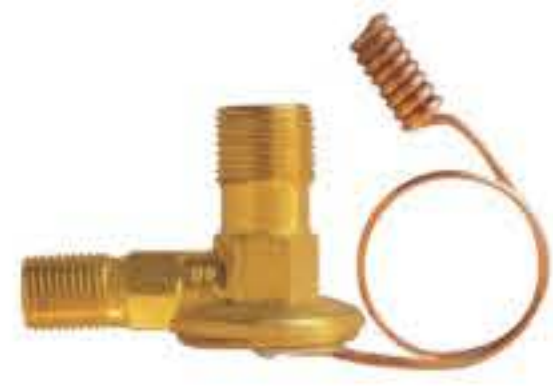
RG-58001 车型: 丰田 (TOYOTA) 入口: 9/16-18UNF 出口: 3/4-16UNF 配件: O型 制冷量: 0.5T-2.0T 88515-16040