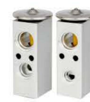
RG-58702 RCH6234 奔驰140 BENZ 140 1408300384