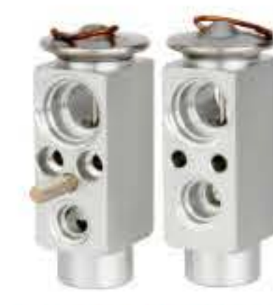
RG-58703 RCH6261 奔驰 BENZ A0038307384