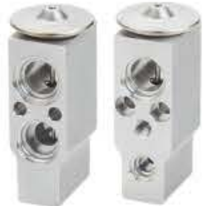
RG-58477 RCH6507 吉利帝豪EC8 F108GC9AA01