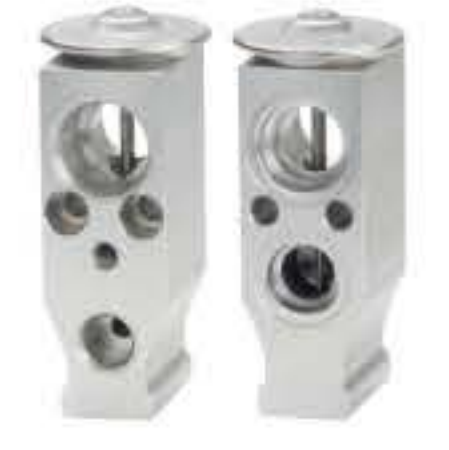
RG-58465 RCH6465 金杯大海狮 11668