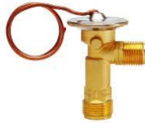
RG-58040 车型：通用 (GM) 入口：3/4-16UNF 出口：5/8-18UNF 配件：O型 制冷量：0.5T-2.0T