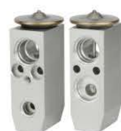
RG-58238 RCH6389 马自达3 MAZDA3 KJ14B32HA02