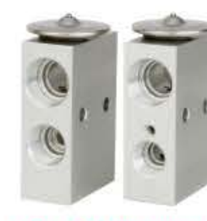
RG-58501 RCH6219 切诺基 R134a CHEROKEE R134a 55036188