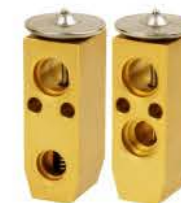
RG-58894 RCH6554 徐工 XCMG HANMA G167215H