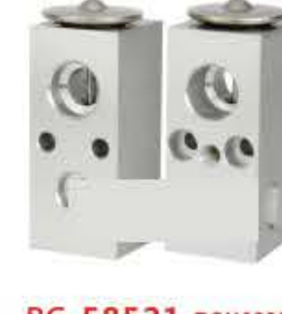
RG-58521 RCH6229 道奇 DODGE 4205085