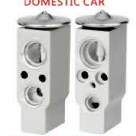
RG-58450 RCH6243 金杯R12 JINBEI R12 HD0216002H