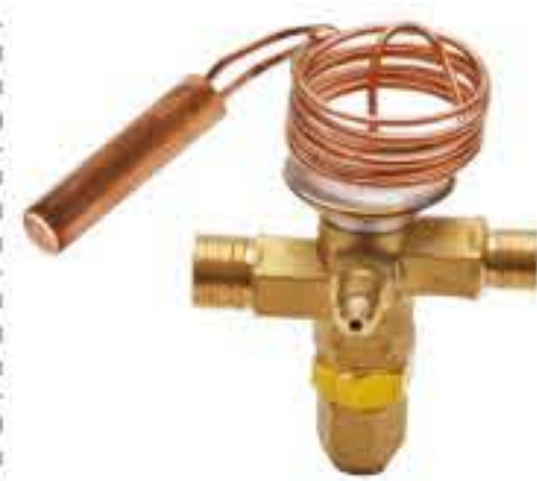
RG-5912 制冷剂：R134a NEW 阀芯规格：3# 最高工作压力：3.0MPa 蒸发温度范围：-40℃~+10℃