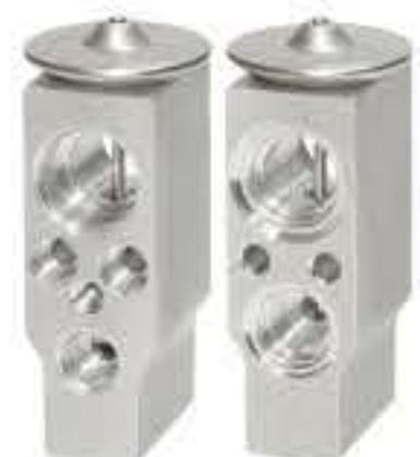
RG-58900 RCH6560 三一搅拌车 SANY AGITATING LORRY A2058308400