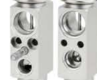
RG-58749 RCH6479 奔驰S600 BENZ S600 2308300184