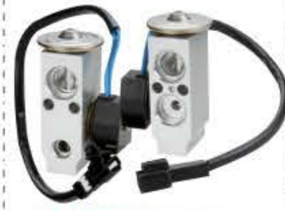
RG-58225 RCH6437 丰田陆地巡洋舰 TOYOTA LAND CRUISER 447510-0071