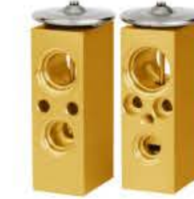
RG-58705-2 RCH6315-2 梅赛德斯W201 MERCEDES W201 2018300784