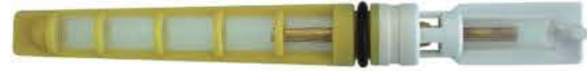
RG-68013 Color:Yellow For:VOLVO Dia:0.062