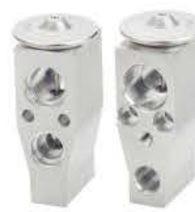
RG-58258 RCH6494 斯巴鲁·森林人、XV SUBARU FORESTER XV T1015442JA