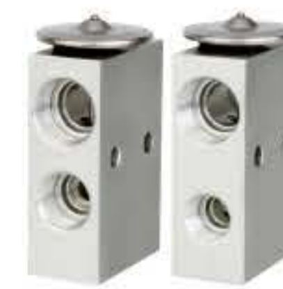
RG-58512 RCH6412 福特卡车 R134A FORD TRUCK 55036189