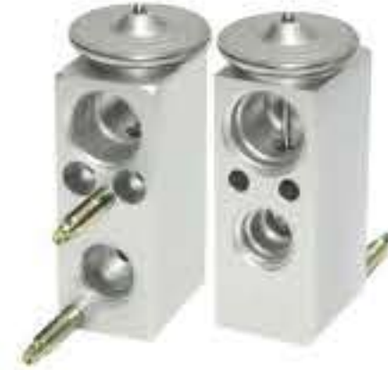
RG-58550 RCH6448 奔驰W211/W204 BENZ W211/W204 A2128300284