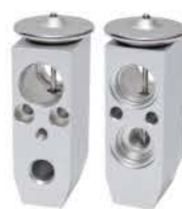
RG-58213 RCH6214 日产皮卡 NISSAN PICKUP 92200-15018H