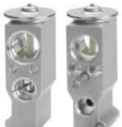
RG-58818 RCH6473 标致新408/T93 PEUGEOT 408/T93 523871B90