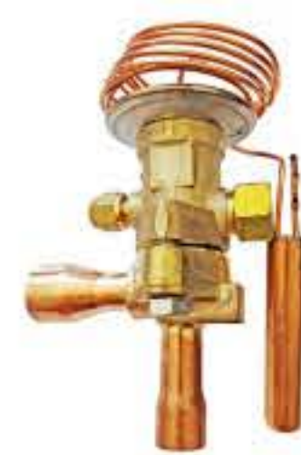
RG-5907 制冷剂：R22 名义容量：35.20Kw 5/8*7/8 蒸发温度范围：-40℃~+10℃