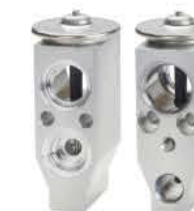
RG-58257 RCH6469 日产奇骏·启辰 NISSAN X-TRAIL . VENUCIA T1032332D