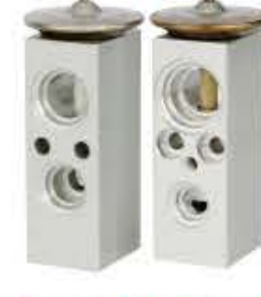
RG-58543 RCH6327 土星 SATURN 24426739