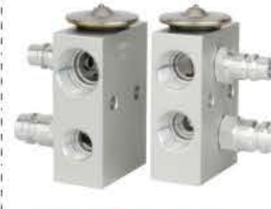
RG-58544 RCH6352 肯沃斯 KENWORTH 329-504