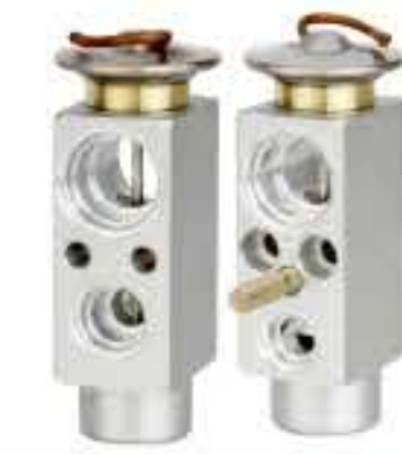
RG-58850 RCH6519 曼 MAN DAF95XF