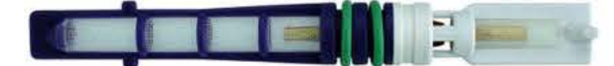
RG-68008 Color:purple T-top For:Chrysler Dia: 0.062