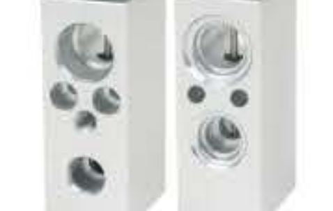
RG-58557 RCH6436 福特新福克斯2009 FORD NEW FOCUS 2009 9M59-19849AA