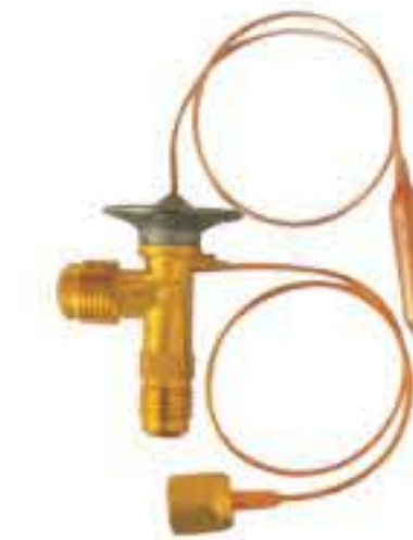
RG-58106 车型： 入口：5/8-18UNF 出口：3/4-16UNF 平衡器：7/16-20UNF 配件：F型 制冷量：0.5T-2.5T