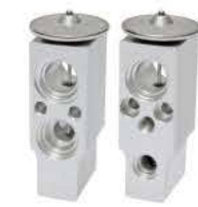
RG-58869 RCH6531 沃尔沃搅拌车 VOLVO 10M7Y1