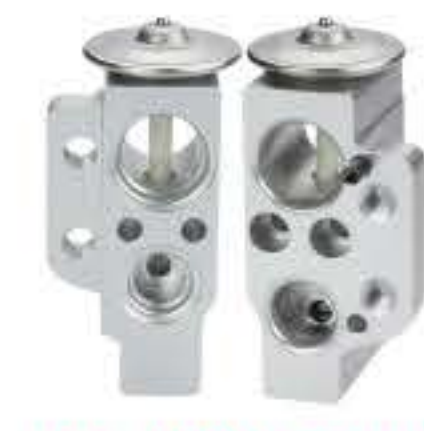
RG-58746 RCH6461 奥迪A4 A5 Q5 AUDIA4 A5 Q5 8K0 820C 679A