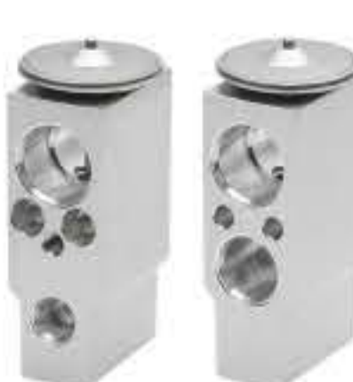
RG-58264 RCH-7016 深孔本田CRV HONDA 447500-9071A NEW