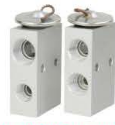
RG-58723-1 RCH6400-1 奔驰、宝马、R12 BENZ BMW R12 1238301184