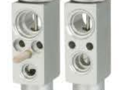
RG-58726 RCH6383 宝马5系.MINI BMW 5 MINI 64118390612