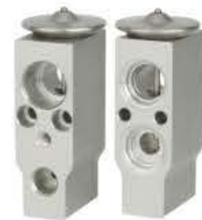
RG-58229 RCH6284 东南三菱君阁2.4 MITSUBISHI ZINGER 2.4 583714-1580