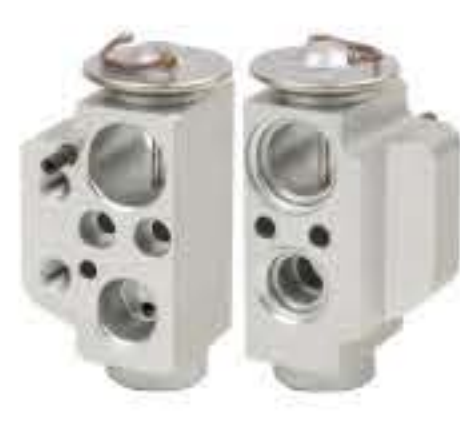
RG-58739 RCH6438 大众福斯T5后置 V.W T5 REAR 7H0820712