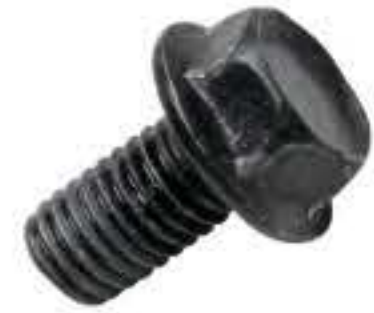
RG-12# 外六角法兰面M8*1.25 长度16MM(镀黑)