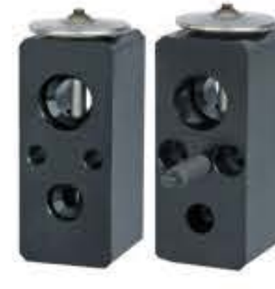
RG-58529 RCH6360 克莱斯勒 CHRYSLER 55036079AF