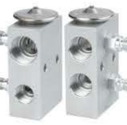
RG-58560 RCH6452 肯沃斯T600 KENWORTH