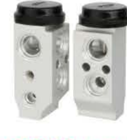
RG-58412 RCH6288 中东三菱FUSO重卡/H1(左舵) MITSUBISHI FUSO/H1 A1W00803