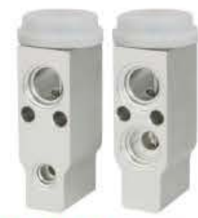
RG-58404 RCH6342 起亚锐欧 KIA RIO 97626F-D200