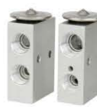
RG-58872 RCH6533 三一重卡 SANY TRUCK 55036188H