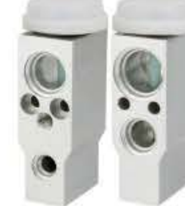
RG-58547 RCH6409 雪佛兰AVEO新款 NEW CHEVROLET AVEO 9043390