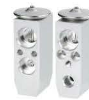
RG-58884 RCH6544 新大威/霸龙507 134a DAWEI(NEW)/BALONG507 134a 410D6544