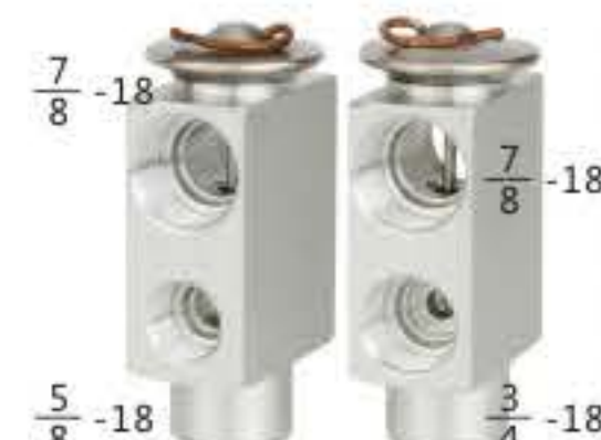
RG-58715 RCH6316 桑塔纳3000型/99新秀 SANTANA 3000