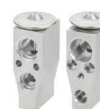
RG-58262 RCH6506 日产(进口) NV350 NISSAN, TIIDA1.6/1.8 10QTEX-20