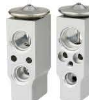
RG-58899 RCH6559 豪运新款 GET LUCKY NEW H1300YG89