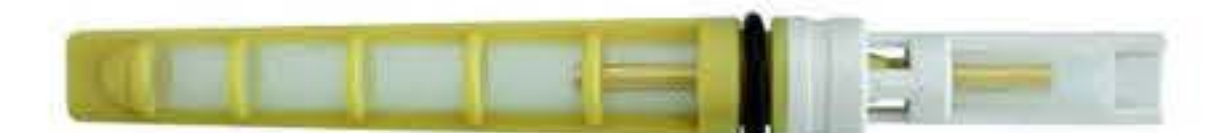
RG-68010 Color:Yellow T-top Dia: 0.062