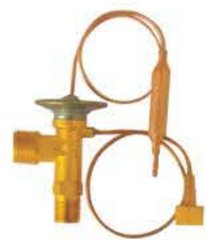
RG-58102 车型：马自达 (MAZDA) 入口：5/8-18UNF 出口：3/4-16UNF 平衡器：7/16-20UNF 配件：O型 制冷量：0.5T-2.5T 1-8-97049-428-O