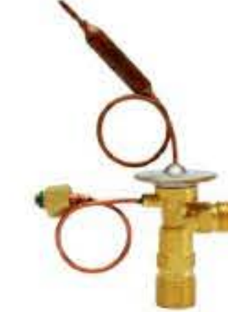
RG-58110 车型：尼桑 (NISSAN) 入口：M16X1.5 出口：M20X1.5 平衡器：M12X1.25 配件：O型 制冷量：0.5T-2.5T