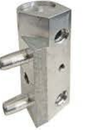
RG-10003 通用油冷阀 THA-18H916