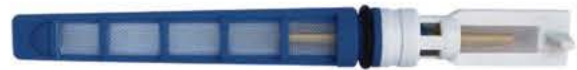
RG-68021 Color:Blue For:GM Dia:0.067