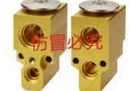
RG-58724-1 RCH6217-1 捷达王 JETTA A-6N0820679A 专利号ZL201020606563.2