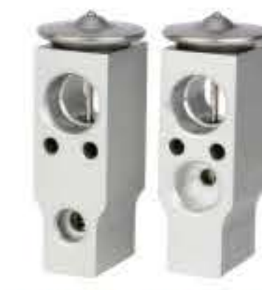
RG-58851 RCH6535 日野货车 HINO TRUCK 447500-2190