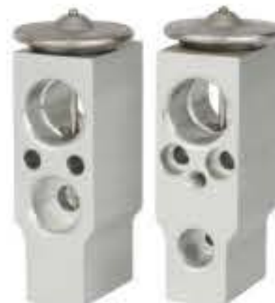
RG-58235 RCH6372 泰国丰田威驰 TOYOTA VIOS 447500-3030