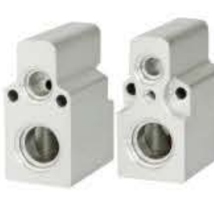
RG-58806 RCH6386 雷诺 RENAULT