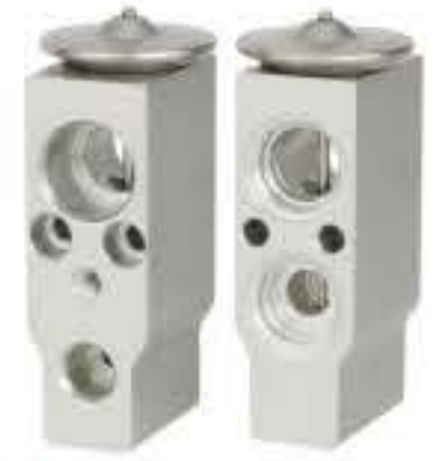
RG-58855 RCH6512 日立挖机-3 HITACHI 34740-G-510