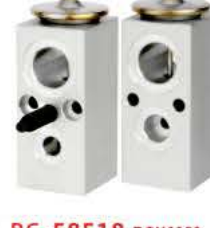
RG-58518 RCH6359 别克 BUICK 10302742