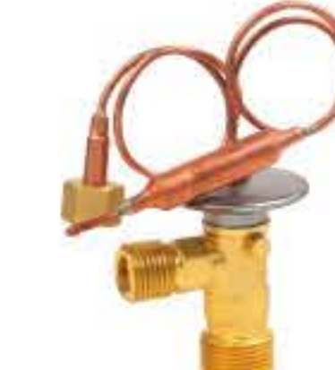
RG-58120 车型：沃尔沃 (VOLVO) 入口：M16X1.5 出口：M20X1.5 平衡器：7/16-20UNF 配件：O型 制冷量：0.5T-2.5T