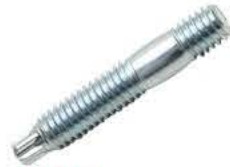
RG-4# 梅花头双头螺/M6*1.0 长度35MM(镀白)