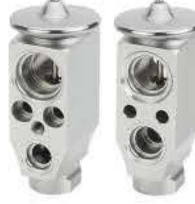
RG-58476 RCH6505 一汽B30 FAW B30 FZ8107100-A