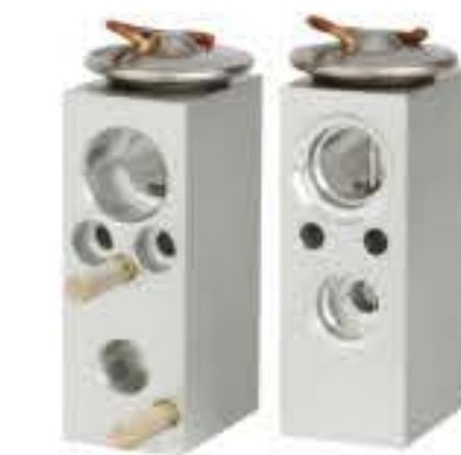
RG-58511 RCH6357 福特 蒙迪欧 FORD MONDEO 6Q91 19849 AA