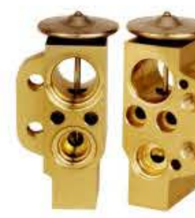
RG-58709 RCH6225-1 大众波罗 V.W MAGOTAN V-6Q820679