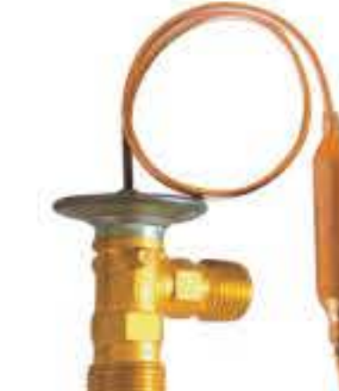
RG-58023 车型: 本田 (HONDA) 入口: 3/4-16UNF 出口: 5/8-18UNF 配件: O型 制冷量: 0.5T-2.0T