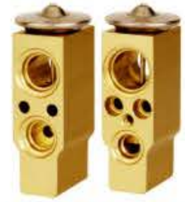
RG-58800-1 RCH6226-1 标致405 PEUGEOT 405 A1688300284