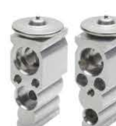
RG-58267 RCH-7031 日产启辰D60 J1515-40390 NEW