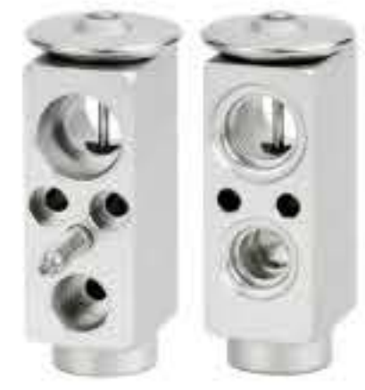
RG-58469 RCH6484 长城皮卡 PICKUP