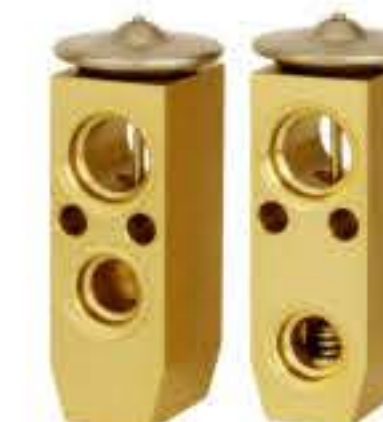
RG-58216 RCH6215 日产阳光 NISSAN SUNNY 92200-2W100