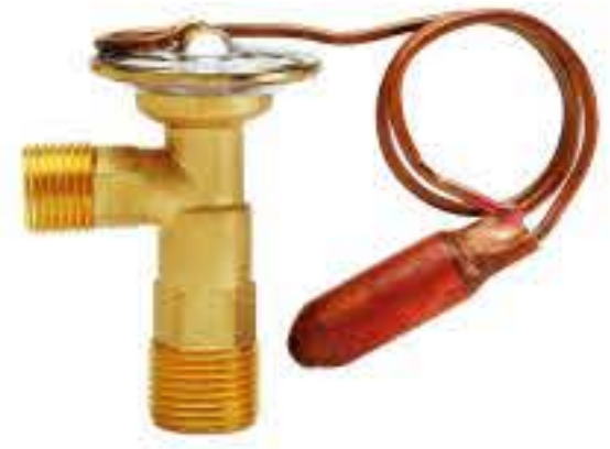
RG-58041 车型：全顺 (TRANSIT) 入口：3/4-16UNF 出口：5/8-18UNF 配件：O型 制冷量：0.5T-2.0T