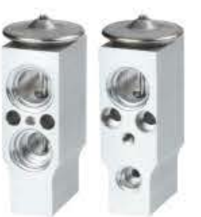
RG-58255 RCH6457 新款日产帅客 NEW NISSAN SUCCE 92200-2016H