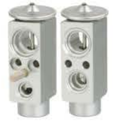
RG-58888 RCH6548 重汽金王子 N21651820516 N776200Z