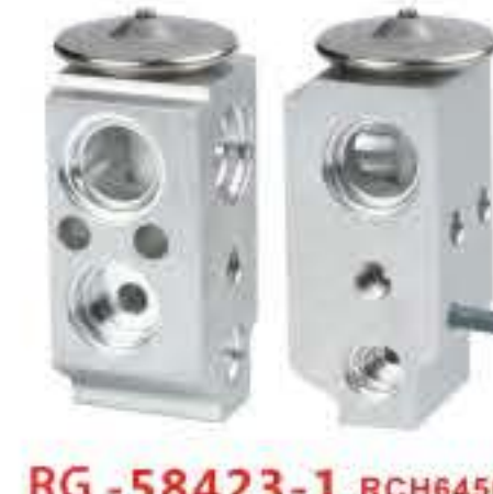
RG-58423-1 RCH6456-1 起亚 KIA T41623-0790