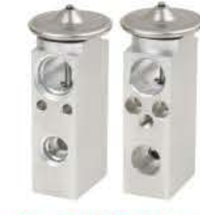
RG-58503 RCH6391 吉普 JEEP 52099AE