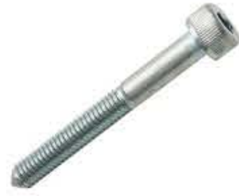
RG-9# 内六角M5*1.0 长度40MM(镀白)