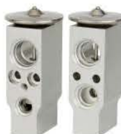
RG-58245 RCH6238 哈飞赛马1.0T/欧兰德 HAFEI SIMBO MR568829