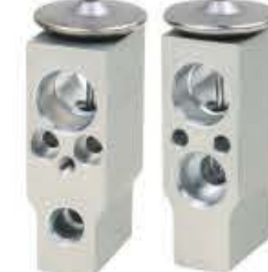
RG-58207-1 RCH6207-1 本田CRV HONDA CRV 447500-1580