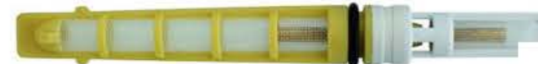
RG-68011 奥迪100 A6 4B0820177 Color:Yellow T-top For:GM Dia: 0.062