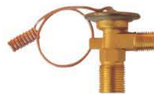
RG-58013 车型: 通用 (GM) 入口: 3/4-16UNF 出口: 5/8-18UNF 配件: O型 制冷量: 0.5T-2.0T