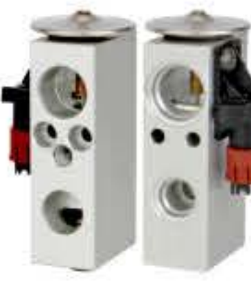
RG-58533 RCH6366 克莱斯勒 CHRYSLER 5019218AE