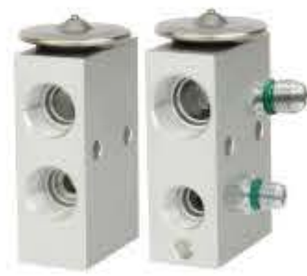
RG-58572 RCH6502 肯沃斯 KENWORTH