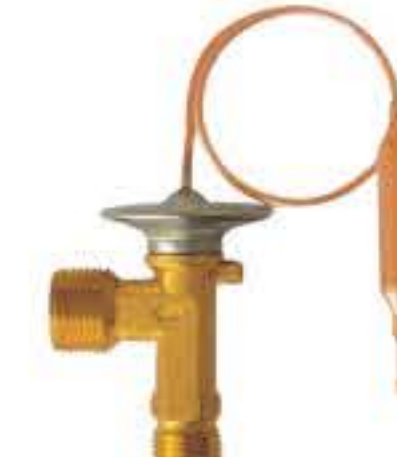
RG-58024 车型: 入口: M16x1.5 出口: M20x1.5 配件: O型 制冷量: 0.5T-2.0T