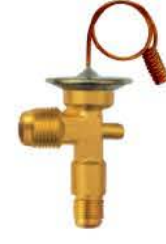
RG-58029 车型: 入口: 5/8-18UNF 出口: 3/4-18UNF 配件: F型 制冷量: 1.5T-2.0T