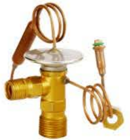
RG-58108 车型：三菱(MITSUBISHI) 入口：9/16-18UNF 出口：3/4-16UNF 平衡器：7/16-20UNF 配件：O型 制冷量：0.5T-2.5T OE:M-MR168024