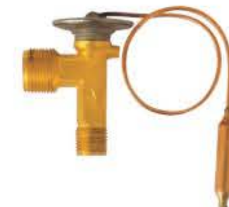
RG-58028 车型: 本田 (HONDA) 入口: M16x1.5 出口: M22x1.5 配件: O型 制冷量: 1.2T