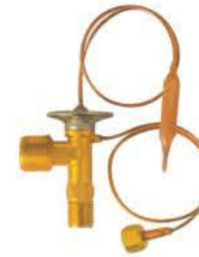
RG-58105 车型：本田 (HONDA) 入口：M16X1.5 出口：M22X1.5 平衡器：M12X1.25 配件：O型 制冷量：0.5T-2.5T