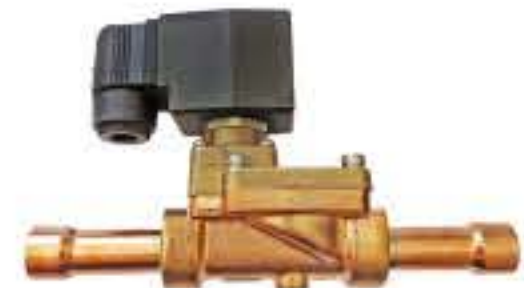
RG-5910 额定电压：DC12V 工作介质：R22/R502 最高工作压力：3.0MPa