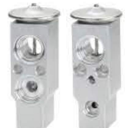
RG-58891 RCH6551 解放J6 FAW JIEFANG J6 3571-1312F