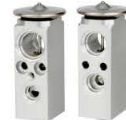
RG-58716 RCH6235 奔驰140 BENZ 140 1408300484