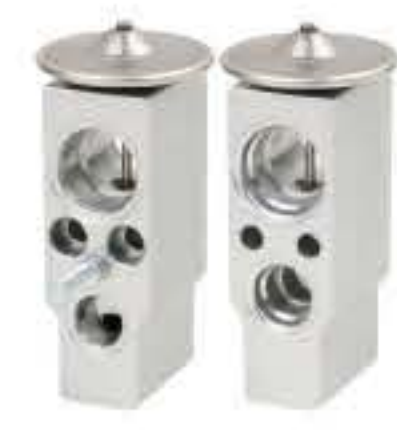
RG-58737 RCH6430 奔驰168 BENZ168 1688300284