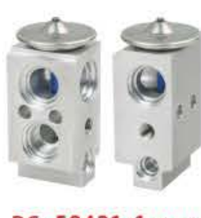
RG-58421-1 RCH6439 现代名图 HYUNDAI MISTAR 97626-4P000