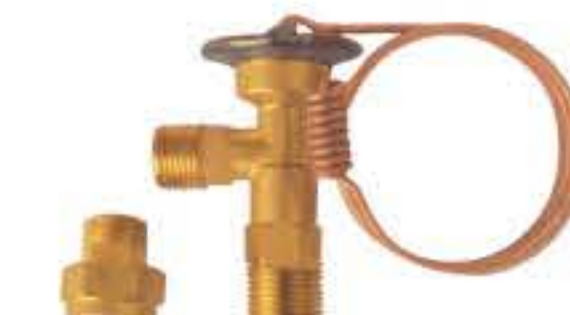
RG-58020 车型: 入口: M20x1.5 出口: M16x1.5 配件: O型 制冷量: 0.5T-2.0T