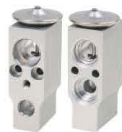
RG-58229-1 RCH6284-1 东南三菱君阁2.4 MITSUBISHI ZINGER 2.4 503714-1501