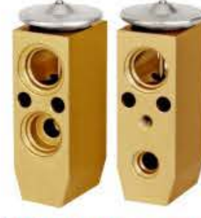
RG-58406 RCH6213 现代 索纳塔 HYUNDAI SONATA 97626-38000