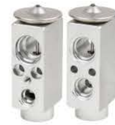
RG-58735 RCH6220-2 德国MAN重卡 MAN TRUCK 140 830 04 84