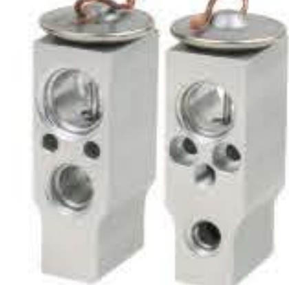
RG-58547-1 RCH6409-1 雪佛兰AVEO CHEVROLET AVEO H5495002