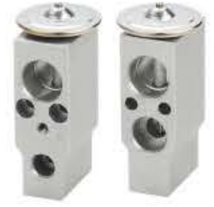
RG-58478 RCH6508 东风景逸S500 BM3-810001S