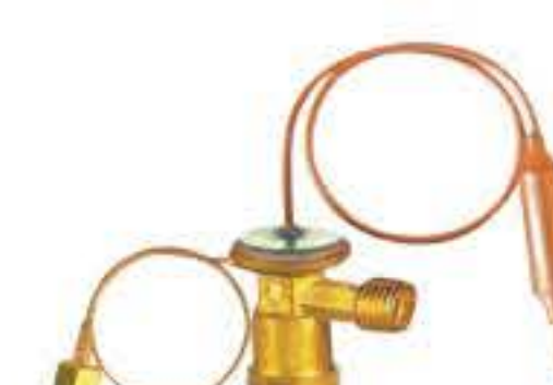
RG-58109 车型： 入口：5/8-18UNF 出口：3/4-16UNF 平衡器：7/16-20UNF 配件：O型 制冷量：0.5T-2.5T