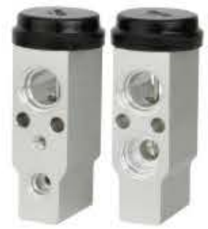
RG-58414 RCH6326 现代索纳塔 HYUNDAI 97604-26000