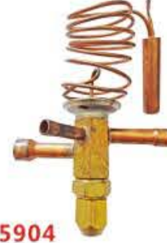
RG-5904 入口：3/8 出口：1/2 外平衡：1/4 工作介质：R22/R134a/R410A/ R507R404A/407C