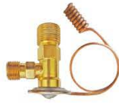
RG-58002-1 车型: 马自达 (MAZDA) R12 入口: 5/8-18UNF 出口: 3/4-16UNF 配件: O型 制冷量: 0.5T-2.0T