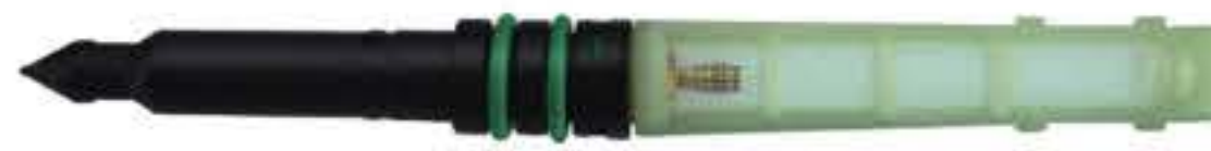
RG-68016 White Eyaporator