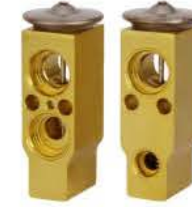
RG-58204 RCH6345 丰田R134a TOYOTA R134A 447500-1030