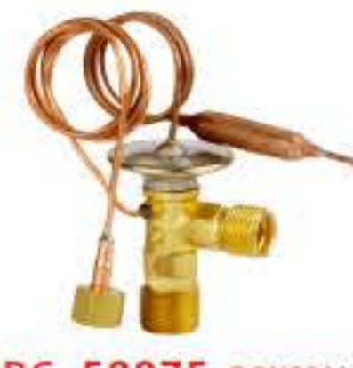
RG-58875 RCH6511 卡特320B挖机 CATERPILLAR 320B 入口: M16X1.5 出口: M20X1.5 92200-59G00