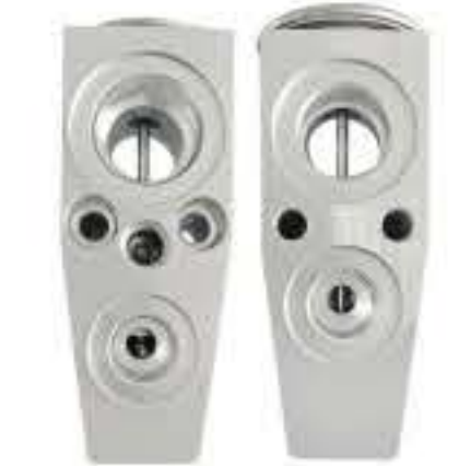
RG-58573 RCH6504 进口指南者2.4L IMPORT JEEP COMPASS AA447500-4110