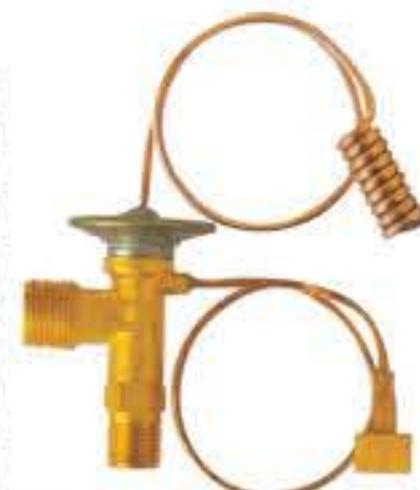
RG-58102-1 车型：马自达 (MAZDA) 入口：5/8-18UNF 出口：3/4-16UNF 平衡器：7/16-20UNF 配件：O型 制冷量：0.5T-2.5T 1-8-97049-428-O