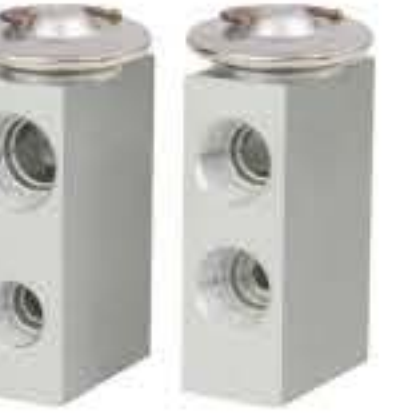
RG-58542-1 RCH6406-1 澳大利亚福特卡车 R12 FORD TRUCK 134684073