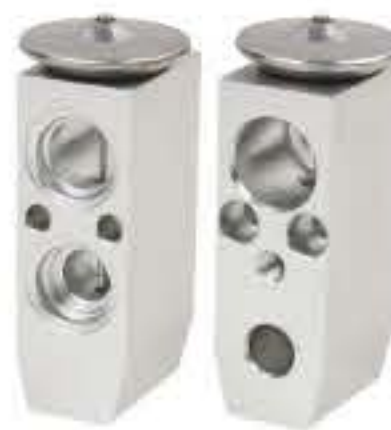
RG-58230 RCH6443 蓝瑟新款/日产铃木 LANCER NEW/NISSAN SUZUKI MR568829