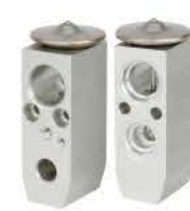
RG-58862 RCH6524 东风柳汽霸龙507 R12 DONGFENG DRAGON 507 R12 1534N530