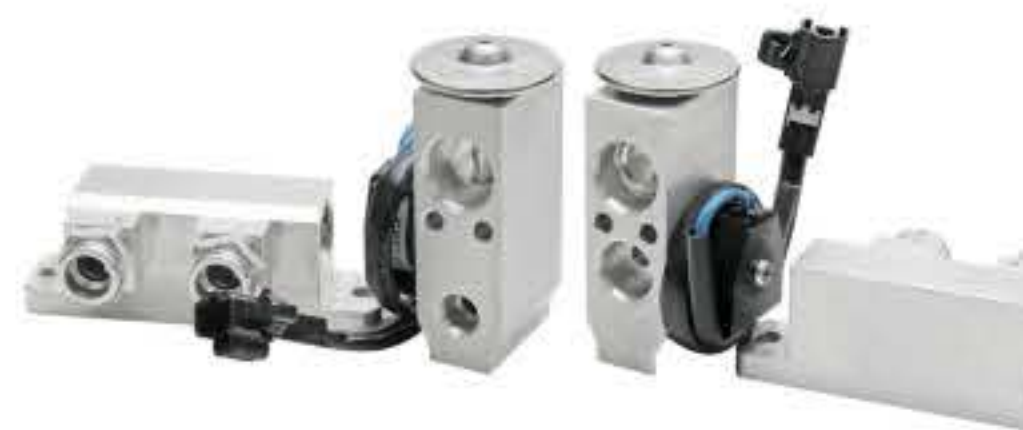
RG-58763 RCH-7023 雷克萨斯L5430 88515-50170 NEW