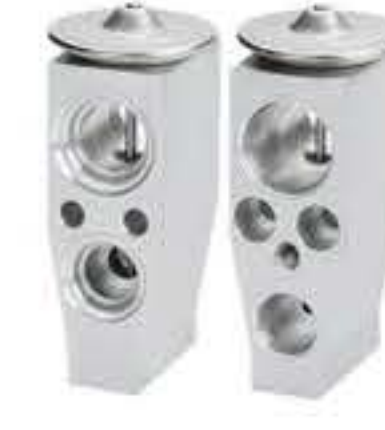
RG-58755 RCH6459 高尔夫7代、大众凌度、 15款明锐 5Q0820679C