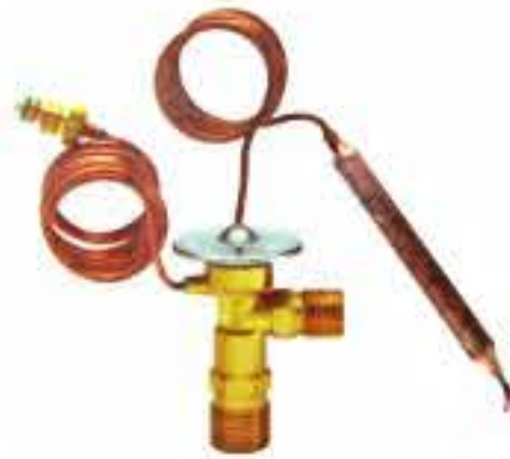
RG-58134 车型: 别克 (BUICK) 入口: 3/4-16UNF 出口: 5/18-18UNF 平衡器: 7/16-20UNF 配件: O型 制冷量: 0.5T-2.5T