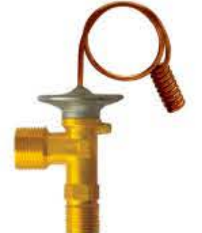
RG-58025 车型: 入口: M16x1.5 出口: M20x1.5 配件: O型 制冷量: 0.5T-2.0T