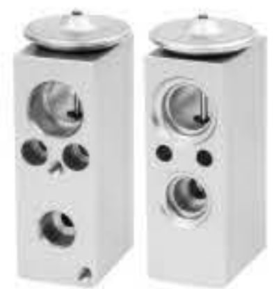
RG-58809 RCH6434 东风雪铁龙C2 C3 (∅11.2) CITROEN C2 C3 665406R