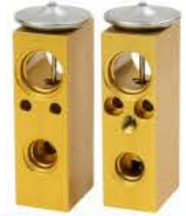
RG-58523-1 RCH6231-1 道奇 DODGE 4882343HB