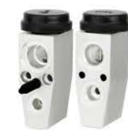
RG-58510 RCH6355 福克斯/雪佛兰/科鲁兹/英朗 FOCUS/CHEVROLET/CRUZE 13263312