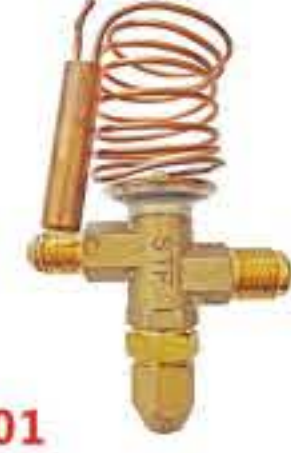
RG-5901 入口：3/8 出口：1/2 外平衡：1/4 工作介质：R22/R134a/R410A/ R507R404A/407C