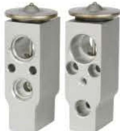
RG-58231 RCH6296 尼桑/骐达 NISSAN /TIIDA 92200-52010