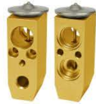
RG-58214 RCH6214-1 日产皮卡 NISSAN PICKUP 92200-15018H