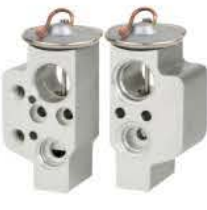
RG-58710-1 RCH6319-1 大众途锐 V.W TOUAREG 7L08200679A