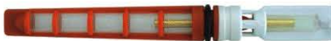
RG-68022 Color:Orange T-top For:GM Dia:0.057