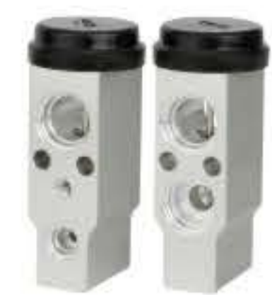
RG-58895 RCH6555 三一七五挖机 SANY 75C EXCAVATOR 97604-26000