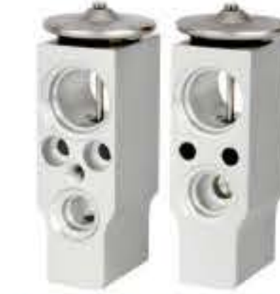
RG-58853 RCH6516 豪沃A7 HOWO A7 WG1664820014