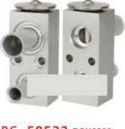
RG-58522 RCH6230 道奇 DODGE 4596318AA