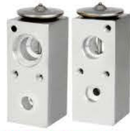
RG-58525 RCH6286 道奇 DODGE FEB171987