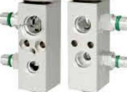
RG-58538-2 RCH-6388-2 NAVISTAR 1696846C3 NEW