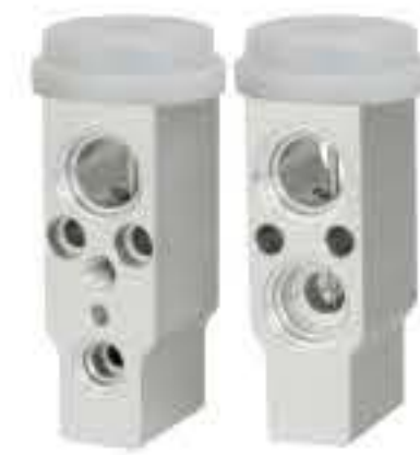
RG-58880 RCH6540 现代-9 HYUNDAI-9 F108KP1AA