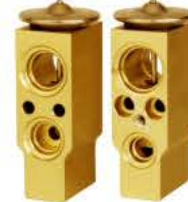
RG-58704-1 RCH6266-1 奔驰202/208/210 BENZ 202/208/210 601229W