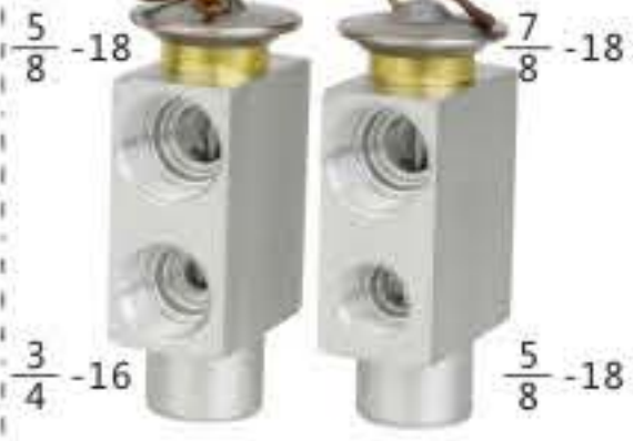
RG-58714 RCH6222 大众时代超人 SANTANA 126 830 0584