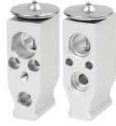
RG-58878 RCH6538 新款豪沃压板 NEW HOWO DS46011021