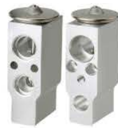
RG-58728 RCH6410 奔驰(泰国) BENZ T1011047TA