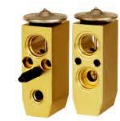
RG-58505-1 RCH6390-1 雪佛兰、乐驰 CHEVROLET AVEO 96539652