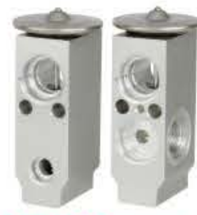
RG-58226 RCH6258 丰田陆地巡洋舰 TOYOTA LAND CRUISER 447510-0071