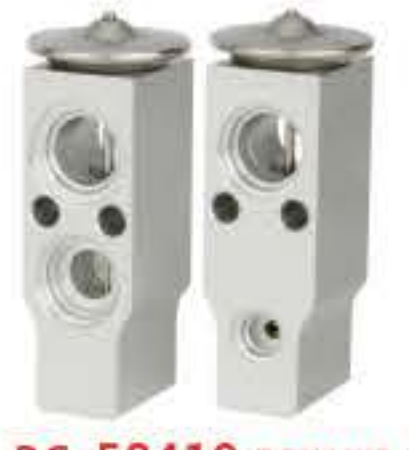
RG-58419 RCH6312 现代阿托斯08 HYUNDAI ATOS A1W00279A