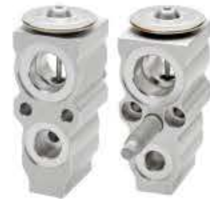
RG-58568 RCH6492 16款君越/君威/迈悦宝 REGAL M23506186