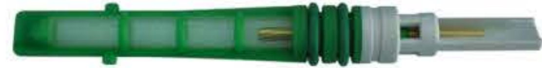
RG-68014 Color:Green For:Ford Dia:0.052