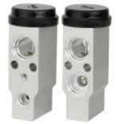
RG-58860 RCH6522 一汽奥威 FAW AOWEI 88515-16040