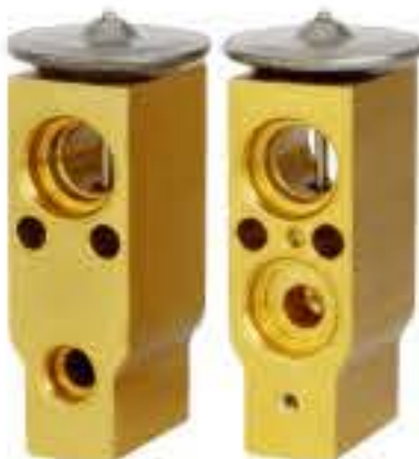
RG-58808-1 RCH6385-1 福特 FORD 861219849A