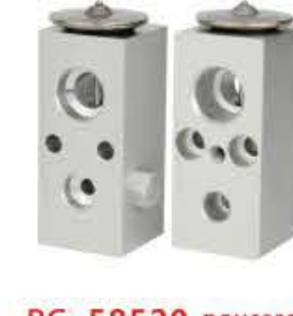
RG-58520 RCH6228 道奇 DODGE D-4116499