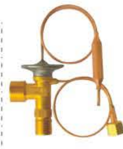
RG-58104 车型：现代 (HYUNDAI)/郑州日产D22 入口：M16X1.5 出口：M20X1.5 平衡器：M12X1.25 配件：O型 制冷量：0.5T-2.5T