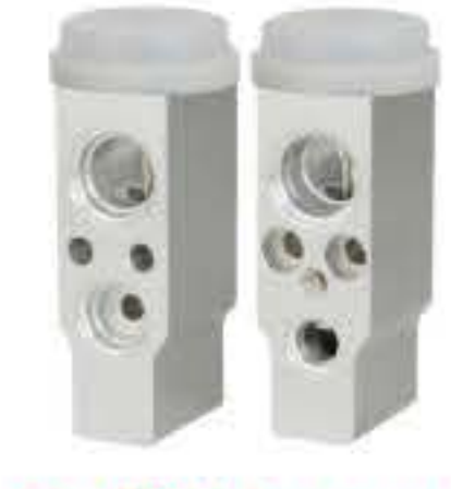
RG-58411 RCH6276 现代酷派 HYUNDAI COUPE SSA3878127