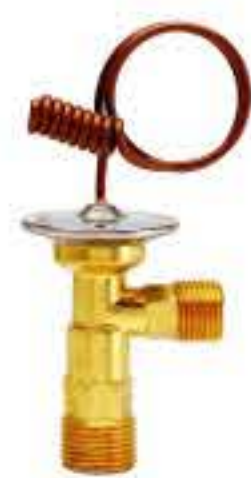
RG-58046 车型： 入口：3/4-16UNF 出口：5/8-18UNF 配件：O型 制冷量：0.5T-2.0T