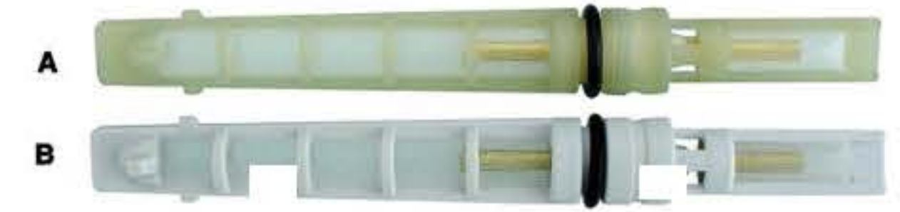
RG-68002 Color:White For:GM Dia: 0.072