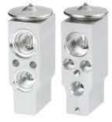
RG-58887 RCH6547 山西大运R12 SAXI DAYUN 126547H000