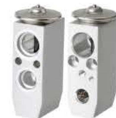
RG-58210 RCH6211 日产奇骏 NISSAN X-TRAIL 92200-9H205