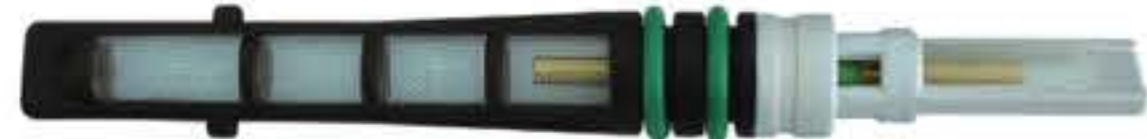
RG-68015 Color:Brown For:Ford Dia:0.072