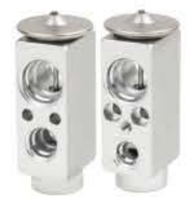
RG-58870 RCH6536 奔驰卡车 BENZ ACTROS 7009315TBF