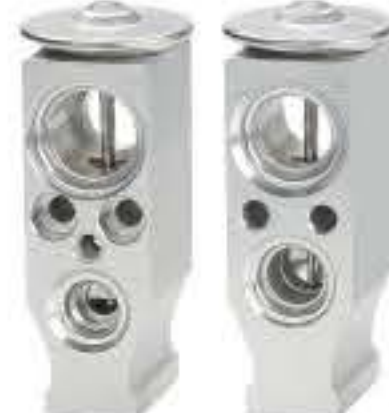
RG-58815 RCH6470 标致 BX3/206 PEUGEOT BX3/206 X887364M