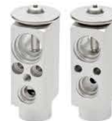
RG-58901 RCH6561 陕汽德龙X3000 Delong 410646