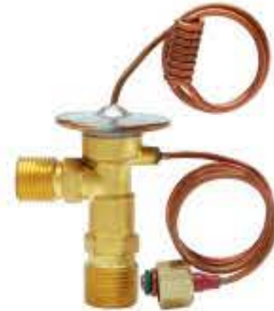
RG-58130 车型: 奥迪 (AUDI) 入口: 5/8-18UNF 出口: 3/4-16UNF 平衡器: 7/16-20UNF 配件: O型 制冷量: 0.5T-2.5T