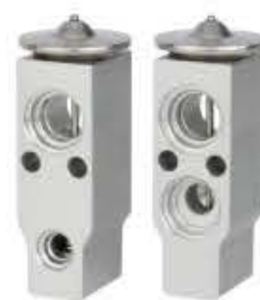
RG-58200 RCH6201-1 丰田R12 TOYOTA R12 047500-9072