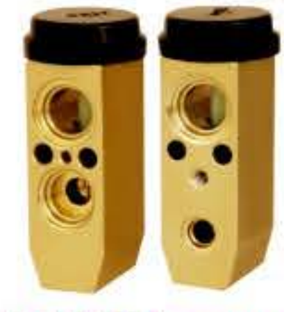
RG-58405 RCH6381 新款索纳塔 SONATA 97626-3E00