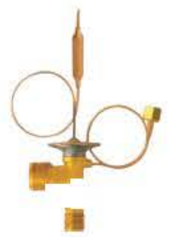
RG-58116 车型：本田 (HONDA) 入口：M16X1.5 出口：M22X1.5 平衡器：M12X1.25 配件：O型 制冷量：0.5T-2.5T