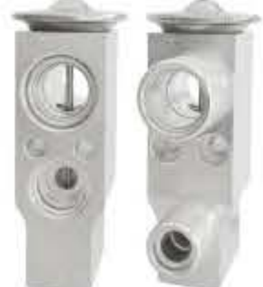
RG-58897 RCH6557 套机专用阀