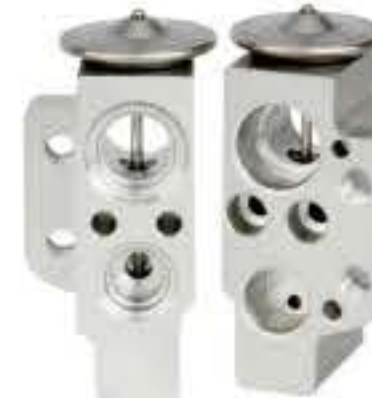
RG-58711 RCH6344 奥迪A3/斯柯达/速腾 AUDI A3 1K0820679