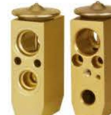
RG-58211 RCH6211-1 日产/千里马 NISSAN QIANLIMA 922004Y80A