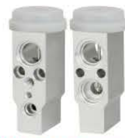
RG Y-58402 RCH6247 现代雅绅特 HYUNDAI ACCENT 97604-1C100