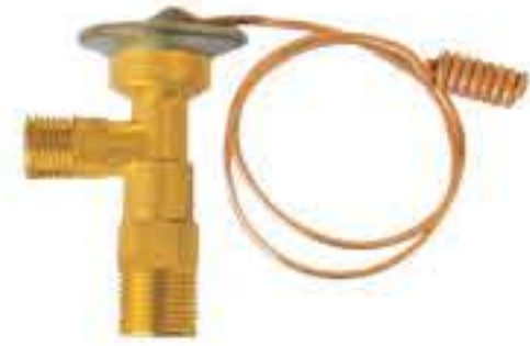
RG-58037 车型： 入口：3/4-16UNF 出口：9/16-18UNF 配件：O型 制冷量：0.5T-2.0T