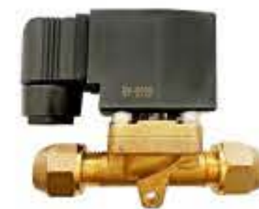
RG-5909 额定电压：DC24V 工作介质：R22/R502 最高工作压力：3.0MPa