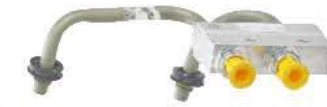
RG-10002 上海通用 THA-12T007