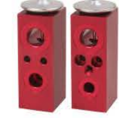
RG-58552 RCH6417 福莱纳 FREIGHTLINER P-BOA93674