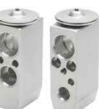
RG-58487 RCH-7025 新款宝骏730 8100131-H2020-Y NEW