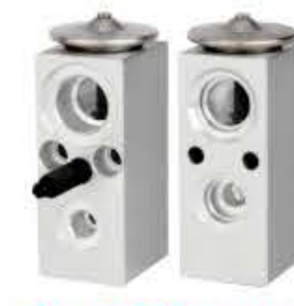
RG-58502 RCH6374 切诺基、吉普大切基指挥官 CHEROKEE 52290890