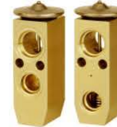
RG-58215 RCH6215-1 日产阳光 NISSAN SUNNY 92200-4P002