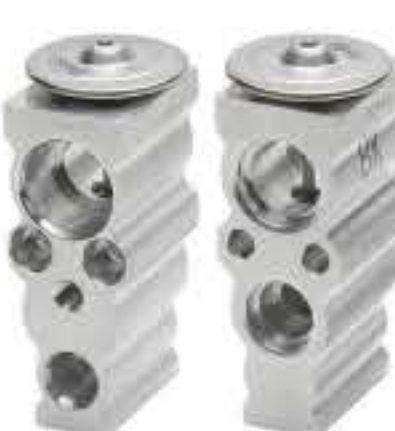
RG-58258-1 RCH-6494-1 斯巴鲁·森林人、XV SUBARU FORESTER XV 73531FL000 NEW