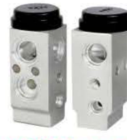
RG-58410 RCH6270 现代途胜/伊兰特VVT HYUNDAI TUCSON/ELANTRA VVT 97626-2E100