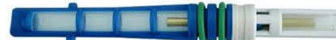
RG-68009 Color:Blue For:Ford Dia: 0.067