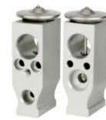
RG-58866 RCH6528 新款德龙 NEW DELONG DZ61841065