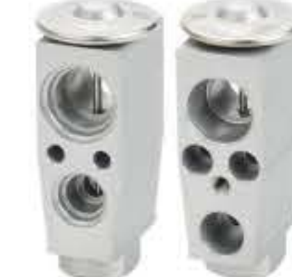
RG-58717 RCH7004 新帕萨特、凌度、 迈腾B8L、途观L 5QD820.679A