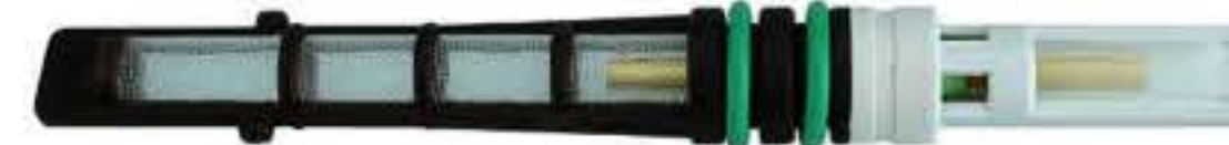
RG-68007 Color:Black For:Ford Dia: 0.072