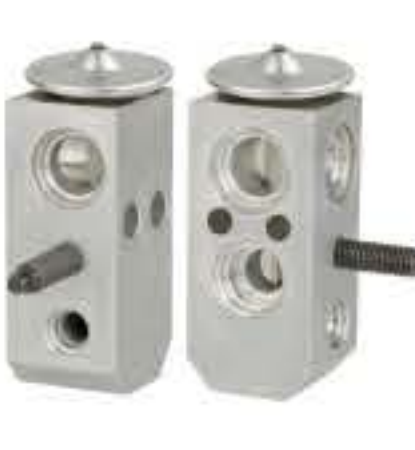
RG-58417 RCH6404 现代 HYUNDAI F108-CB5DA-02