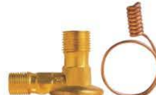
RG-58005 车型: 尼桑 (NISSAN) 入口: M16x1.5 出口: M20x1.5 配件: O型 制冷量: 0.5T-2.0T 92200-59201T