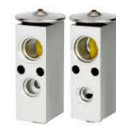
RG-58867 RCH6529 斯堪尼亚 SCANIA 1342237