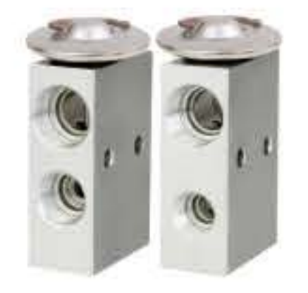
RG-58512-1 RCH6412-1 福特卡车 R134A FORD TRUCK 55036189