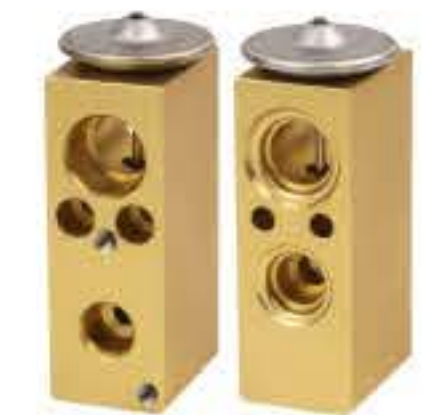
RG-58809-1 RCH6434-1 福特嘉年华 FORD FIESTA MR925874