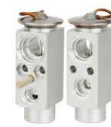
RG-58701 RCH6220-1 奔驰124 BENZ 124 1248300814