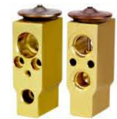
RG-58209 RCH6210-1 五十铃 G510 ISUZU G510 92100921