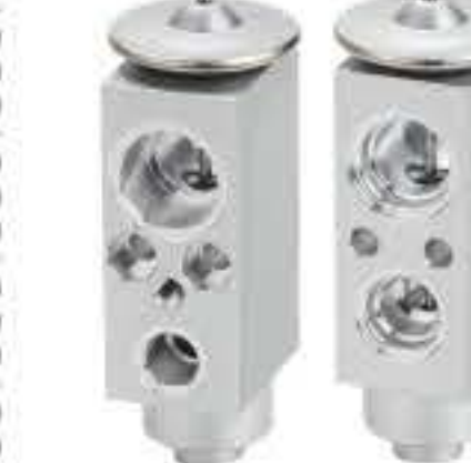
RG-58909 RCH-6569 解放安捷