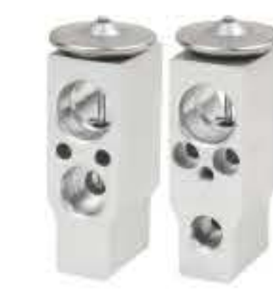
RG-58868 RCH6530 小松-8 KOMATSU-8 447500-3600