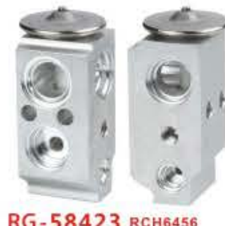
RG-58423 RCH6456 起亚 智跑 KIA K2/K4 K977775-D1000