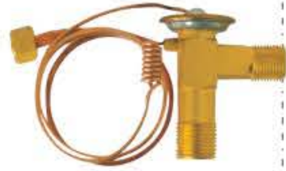
RG-58123 车型: 宝马 (BMW) 入口: 5/8-18UNF 出口: 3/4-16UNF 平衡器: 7/16-20UNF 配件: O型 制冷量: 0.5T-2.5T