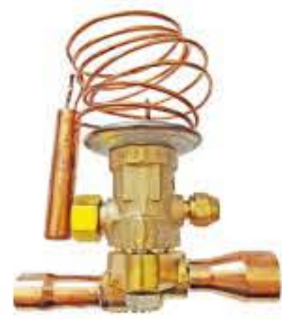
RG-5906 制冷剂：R22 名义容量：35.20Kw 5/8*7/8 蒸发温度范围：-40℃~+10℃