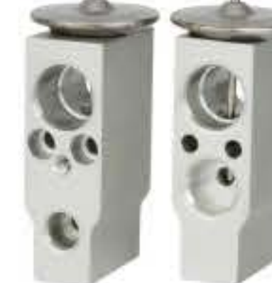
RG-58207 RCH6207 本田CRV HONDA CRV 88515-52010