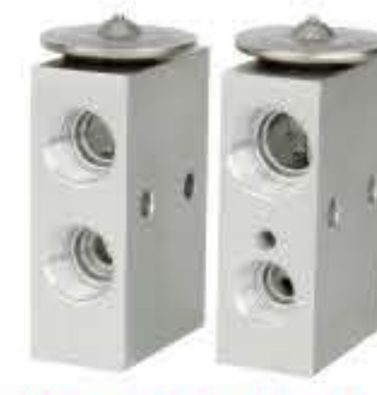
RG-58500 RCH6218 切诺基 R12 CHEROKEE R12 7701026533