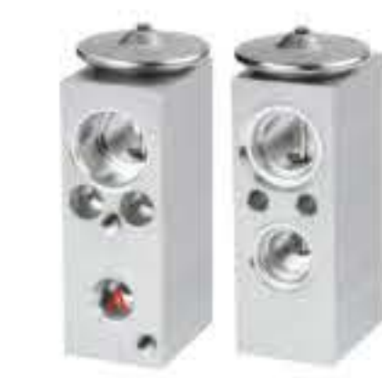
RG-58811 RCH6454 雷诺洛根 RENAULT LOGAN 669603EB A:∅10.2