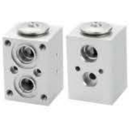
RG-58905 RCH6565 沃尔沃挖机L350F VOLVO EXCAVATOR 2034N544-1B