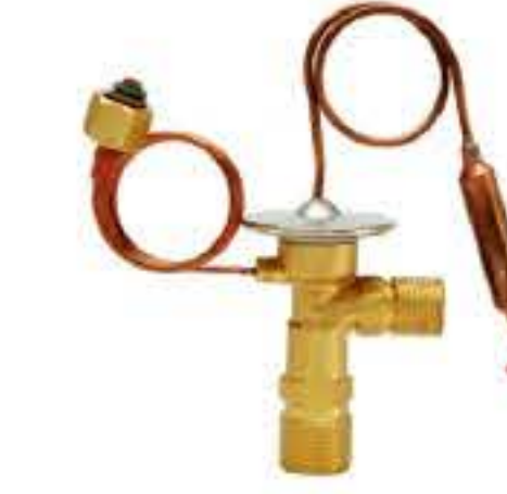
RG-58111 车型： 入口：3/4-16UNF 出口：5/8-18UNF 平衡器：7/16-UNF 配件：O型 制冷量：0.5T-2.5T