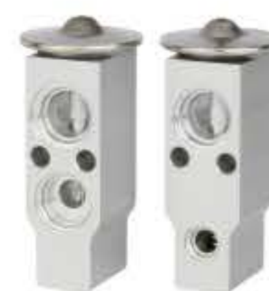
RG-58201 RCH6201 丰田雷克萨斯 TOYOTA LEXUS 447500-1730