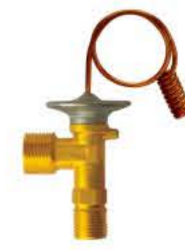
RG-58026 车型: 入口: 3/4-16UNF 出口: 9/16-18UNF 配件: O型 制冷量: 0.5T-2.0T