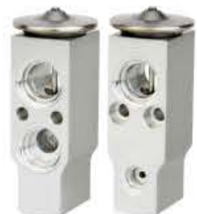
RG-58242 RCH6401 日产URAN NISSAN URAN 503714-1451