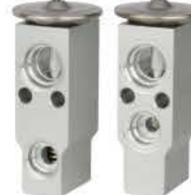
RG-58206 RCH6205 日产途乐/探路者 NISSAN 447500-1311