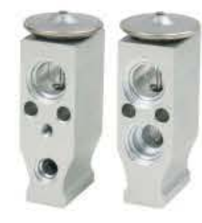
RG-58416 RCH6422 现代圣达菲 HYUNDAI SANTAFE