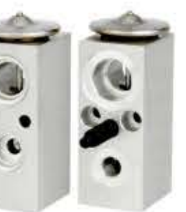
RG-58539 RCH6318 吉普 JEEP 19120829