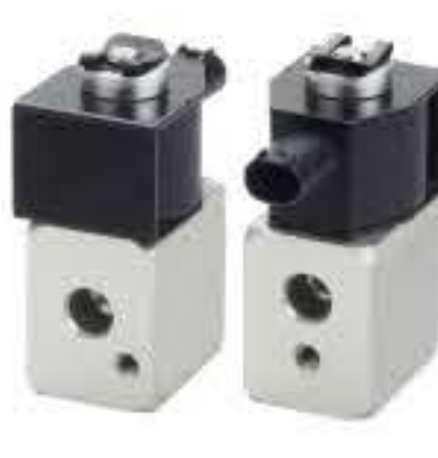
RG-58480 RCH7002 荣威E50油电混合 SOP-60M009