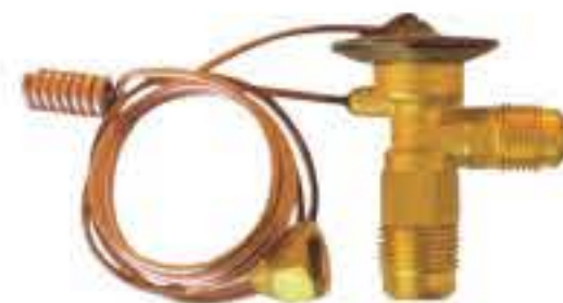
RG-58138 车型: 大众 (V.W) 入口: 5/8-18UNF 出口: 3/4-16UNF 平衡器: 7/16-20UNF 配件: F型 制冷量: 0.5T-2.5T