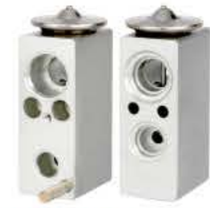
RG-58803 RCH6275 雪铁龙C4 (∅10.2) CITROEN C4 1001738351