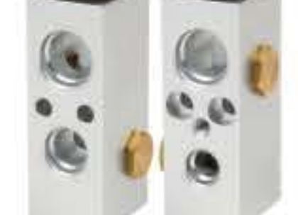
RG-58556 RCH6432 福特/澳大利亚 TX9819 FORD/AUSTRALIA TX9431 929-508