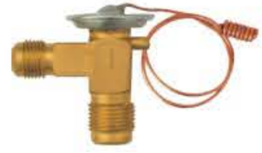
RG-58036 车型： 入口：3/4-16UNF 出口：5/8-18UNF 配件：F型 制冷量：0.5T-2.0T