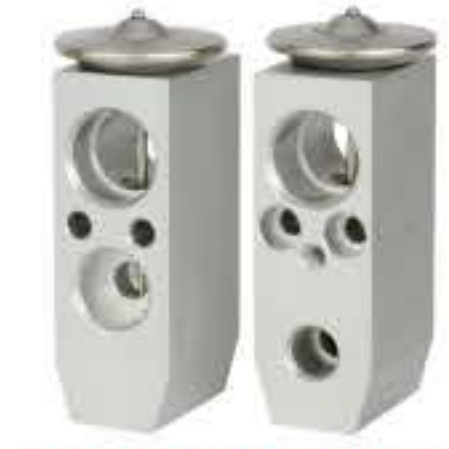
RG-58451 RCH6252 长安之星 CHANGAN STAR 1001738210