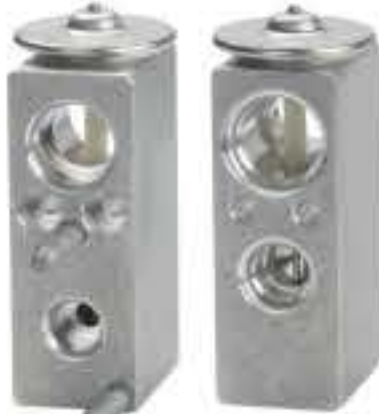
RG-58817 RCH6472 标致 3008/T88 PEUGEOT 3008/T88 524131