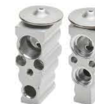
RG-58266 RCH-7028 进口日产英菲尼迪 NISSAN INFINITI T93083A A04 NEW