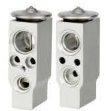
RG-58704 RCH6266 保时捷 PORSCHE 1772728