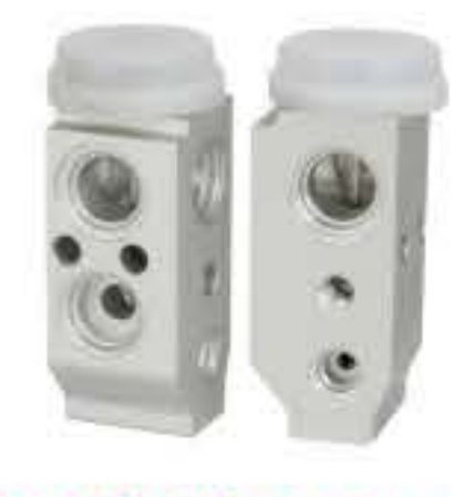
RG-58413-1 RCH6289-1 现代悦动 HYUNDAI ELANTRA 97626-2D100