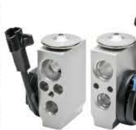
RG-58760 RCH-7020 奔驰唯雅诺/W639 BENZ A6398300484 NEW