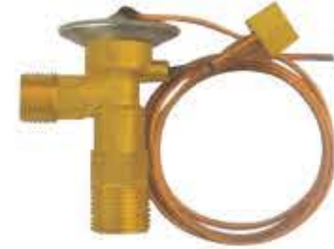
RG-58131 车型: 入口: 3/4-16UNF 出口: 5/18-18UNF 平衡器: 7/16-20UNF 配件: O型 制冷量: 0.5T-2.5T