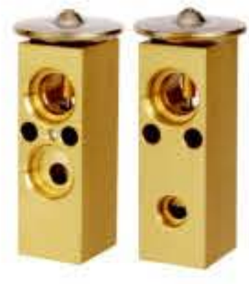
RG-58532 RCH6364 克莱斯勒/道奇/杜兰戈/拓远者 CHRYSLER/DODGE/ 5019630AA