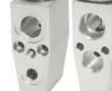
RG-58554 RCH6336 别克 BUICK 89025008