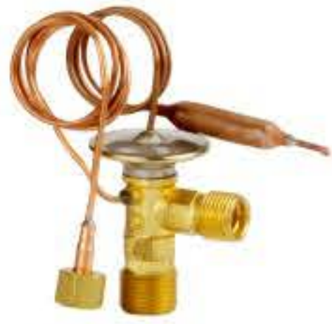
RG-58121 车型: 沃尔沃 VOLVO 入口: 5/8-18UNF 出口: 3/4-16UNF 平衡器: 7/16-20UNF 配件: O型 制冷量: 0.5T-2.5T OE: F-RBE-E1534 OE: V-1215023-1