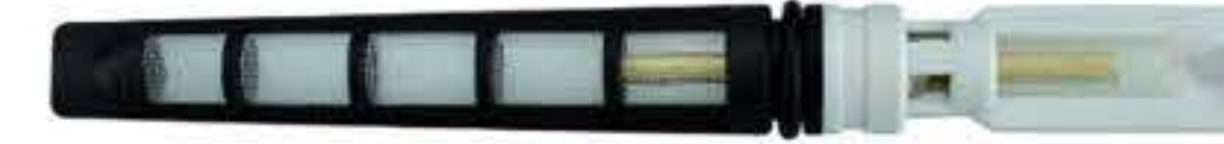
RG-68003 Color:Black T-top For:GM Dia: 0.072