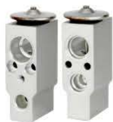
RG-58236 RCH6382 英菲尼迪 尼桑 INFINITI NISSAN 92200-5Z010