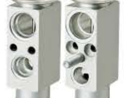
RG-58727 RCH6413 奔驰230/奔驰220 BENZ 230/BENZ 220 220 830 0384