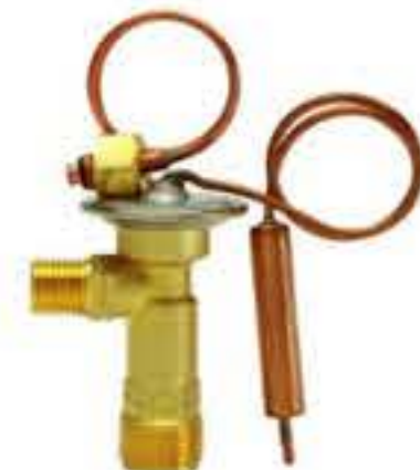
RG-58136 车型: 入口: M16x1.5 出口: M20x1.5 平衡器: M12x1.25 配件: O型 制冷量: 0.5T-2.5T