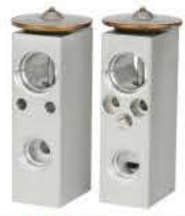
RG-58523 RCH6231 道奇大捷龙公羊 DODGE 4882343HB