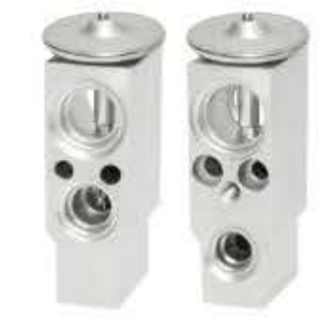
RG-58460 RCH6451 新款金杯 NEW JINBEI 1620H4512