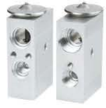
RG-58886 RCH6546 北奔V3M 810 6QXA 010 00