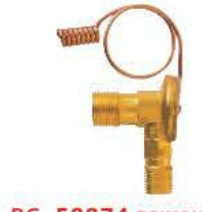
RG-58874 RCH6510 重汽北奔欧曼 BEIBEN HEAVY TRUCK 入口: 5/8-18UNF 出口: 3/4-16UNF 88515-H160