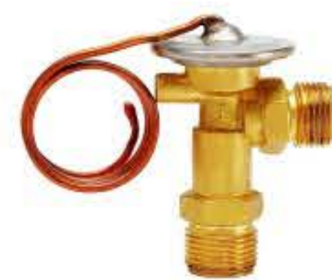
RG-58042 车型：通用 (GM) 入口：20X1.5UNF 出口：18X1.5UNF 配件：O型 制冷量：0.5T-2.0T