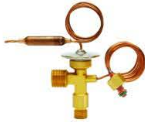
RG-58126 车型: 入口: 9/16-18UNF 出口: 3/4-16UNF 平衡器: 7/16-20UNF 配件: O型 制冷量: 0.5T-2.5T