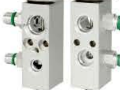
RG-58538-3 RCH-6388-3 肯沃斯 KENWORTH 540056B5M NEW