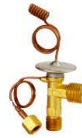
RG-58113 车型： 入口：5/8-18UNF 出口：3/4-16UNF 平衡器：7/16-20UNF 配件：O型 制冷量：0.5T-2.5T