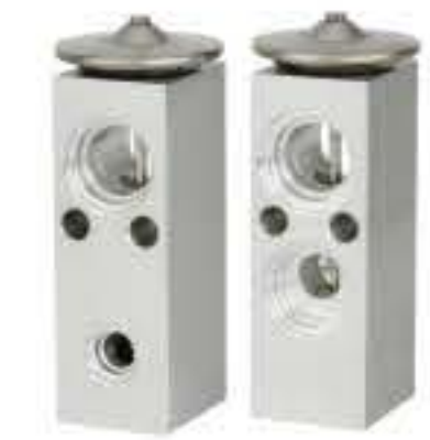
RG-58219 RCH6239 丰田普拉多 TOYOTA PRADO 88515-3301083