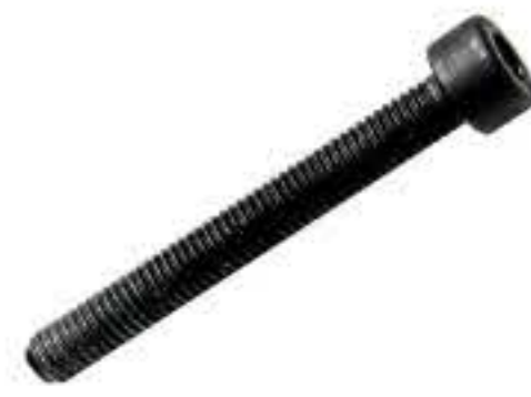
RG-8# 内六角M5*1.0 长度40MM(镀白)