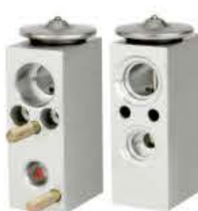
RG-58810 RCH6379 雷诺风朗/福特蒙迪欧 RENAULT FLUENCE FORD MONDEO A:∅10.2