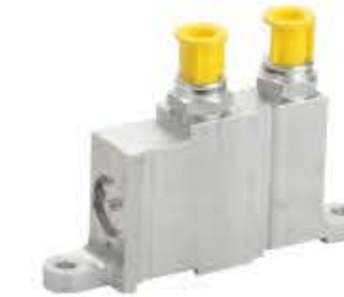
RG-10001 雪佛兰 THA-12T004