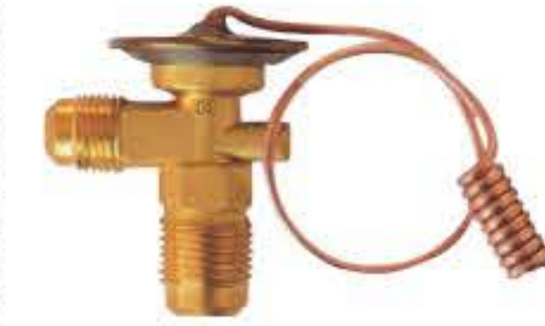
RG-58016 车型: 通用 (GM) 入口: 3/4-16UNF 出口: 5/8-18UNF 配件: F型 制冷量: 0.5T-2.0T