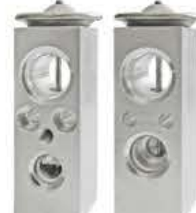
RG-58906 RCH6566 小松(巴西) KOMATSU (BRAZIL) IS400001