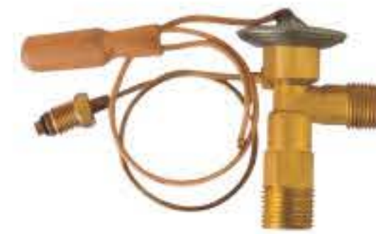
RG-58135 车型: 入口: 3/4-16UNF 出口: 5/18-18UNF 平衡器: 7/16-20UNF 配件: O型 制冷量: 0.5T-2.5T