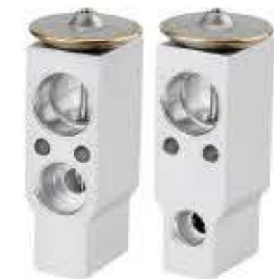
RG-58205-1 RCH6204-1 丰田花冠 TOYOTA COROLLA 447500-1610