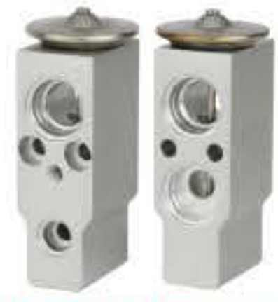
RG-58223 RCH6245 东风日产阳光 NISSAN SUNNY 047500-1730