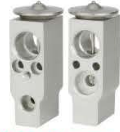
RG-58227 RCH6267 丰田雅力士 TOYOTA YARIS 447500-3070