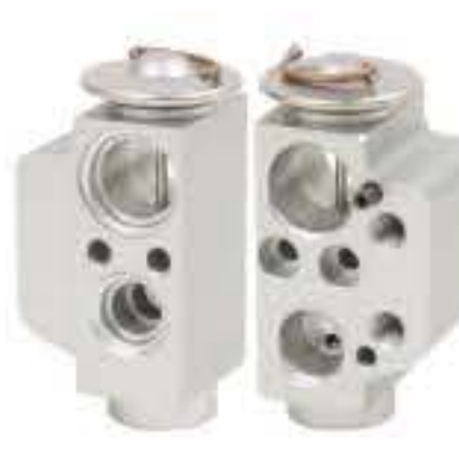
RG-58731 RCH6419 大众福斯T5前套 V.W T5 7H0820679B