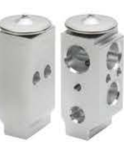
RG-58486 RCH-7017 赛超、电动空调专用阀 SCDD2020-9AHY NEW