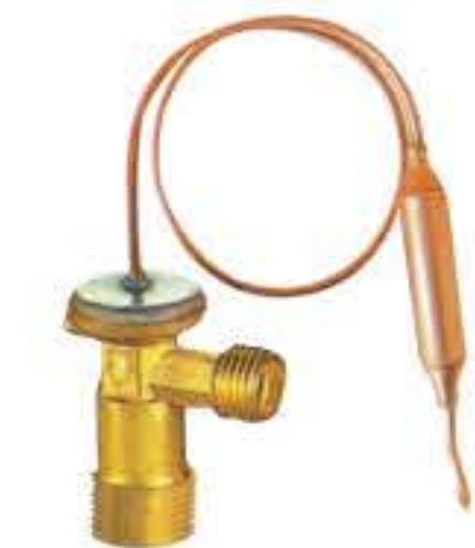
RG-58012 车型: 通用 (GM) 入口: M20x1.5 出口: M16x1.5 配件: O型 制冷量: 0.5T-2.0T