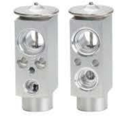
RG-58464 RCH6463 风行景逸X3X5 L9984001