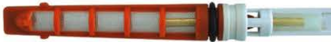
RG-68024 Color:Orange For:Audi Dia:0.057