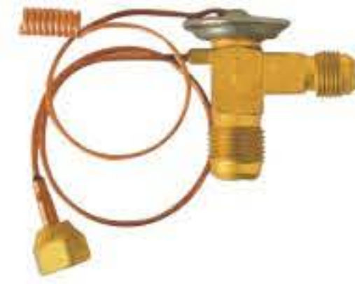
RG-58124 车型: 入口: 5/8-18UNF 出口: 3/4-16UNF 平衡器: 7/16-20UNF 配件: F型 制冷量: 0.5T-2.5T