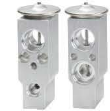
RG-58466 RCH6474 一汽奔腾X80 KJ141B32HA02