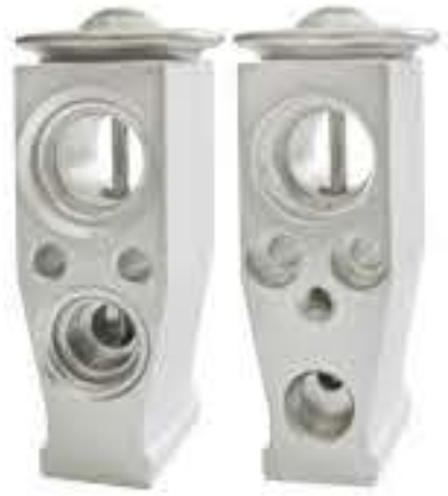
RG-58484 RCH7011 五菱宝骏乐驰 SGMW BAOJUN AVEO