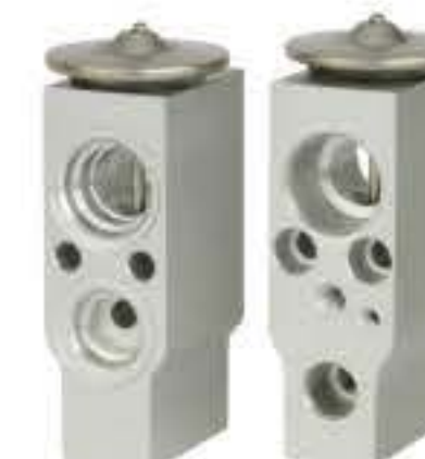
RG-58217 RCH6227 日产天籁 NISSAN TEANA 92200-5M000