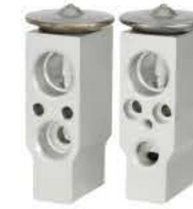
RG-58852 RCH6515 神钢挖机 KOBELCO 447500-1750