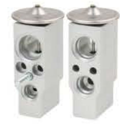
RG-58736 RCH6429 沃尔沃S80.60. VOLVO S80.60 503714-1331