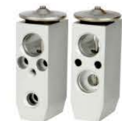
RG-58509 RCH6348 福特嘉年华 FORD FIESTA MR925874