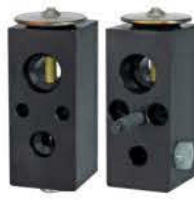
RG-58534 RCH6367 道奇 DODGE 163036A