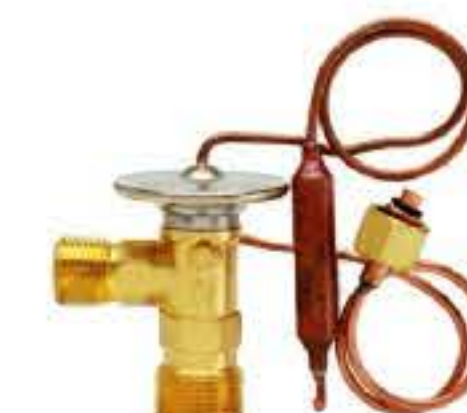
RG-58118 车型：三菱 (MITSUBISHI) 入口：9/16-18UNF 出口：3/4-16UNF 平衡器：7/16-20UNF 配件：O型 制冷量：0.5T-2.5T