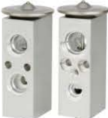
RG-58812 RCH6310 纽荷兰TM150 NEW HOLLAND TM150 81874718