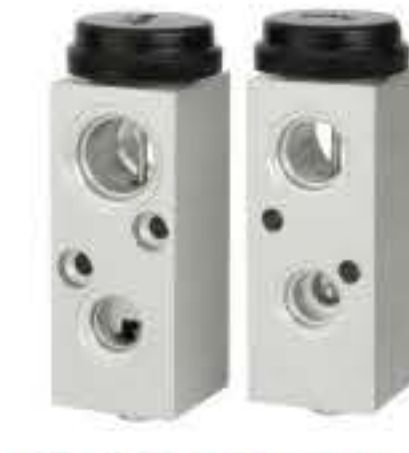
RG-58514 RCH6242 别克凯越 BUICK BPV 9073208