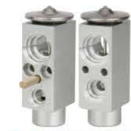
RG-58452 RCH6294 东风 DONGFENG 7009072