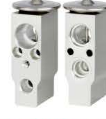
RG-58516 RCH6350 欧宝 OPEL 5247550H