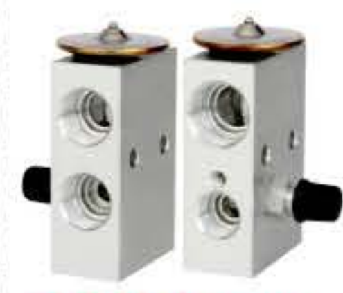
RG-58546 RCH6373 肯沃斯 KENWORTH 71R8400 1676665C1