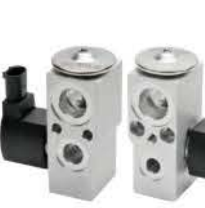
RG-58761 RCH-7021 宝马新款X5后置 NEW