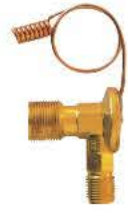
RG-58876 RCH6517 陕汽德龙F2000 R134 SHAANXI DELONG F2000 入口：M16x1.5 出口：M22x1.5