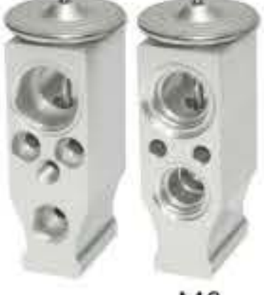
RG-58559 RCH6450 新款凯越1.5 NEW EXCELLE 1.5 16451323