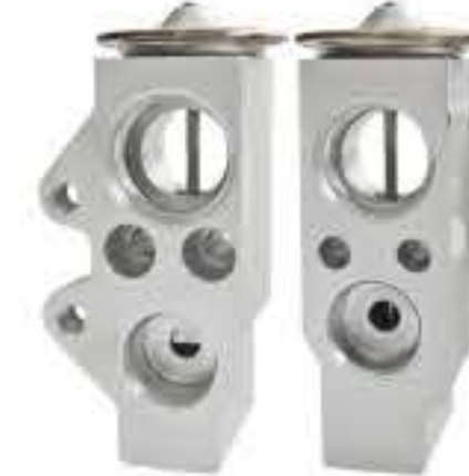
RG-58756 RCH7013 保时捷971/816/590 PORSCHE CZ4007500-4970