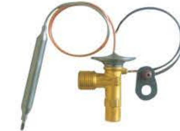
RG-58107 车型：雷克萨斯 (LEXUS) 入口：M16X1.5 出口：M22X1.5 平衡器：7/16-20UNF 配件：O型 制冷量：0.5T-2.5T