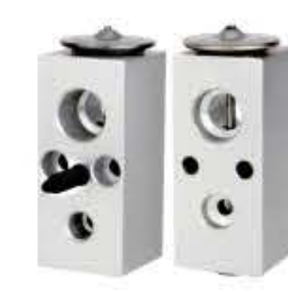
RG-58507 RCH6398 道奇 DODGE 540031