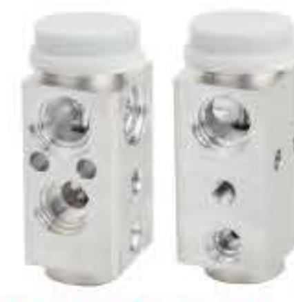
RG-58473 RCH6497 江淮S3/A30 JK703-27A002Z