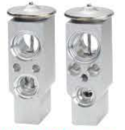
RG-58747 RCH6464 新朗逸/捷达 New lavidajetta 180820679