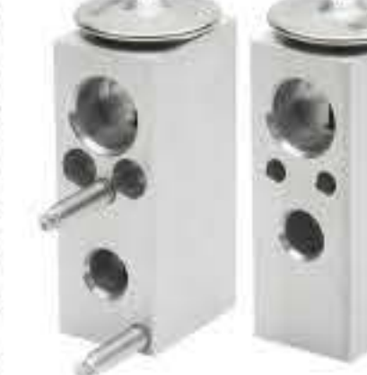
RG-58908 RCH-6568 东风天龙KL/D320 P063201150