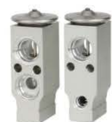
RG-58239 RCH6384 泰国丰田R12 TOYOTA R12 047500-9072