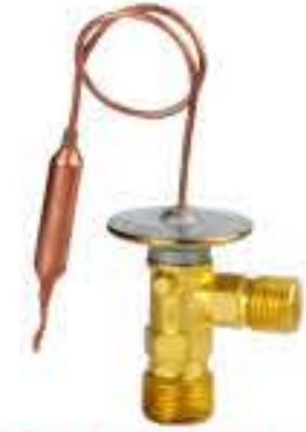
RG-58882 RCH6542 大宇小挖225 60-7 DAEWOO 225 60-7 入口：M16x1.5 出口：M20x1.5 92200-D0101