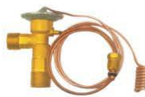
RG-58141 车型: 通用 (GM) 入口: 5/8-18UNF 出口: 3/4-16UNF 平衡器: 7/16-20UNF 配件: O型 制冷量: 0.5T-2.5T