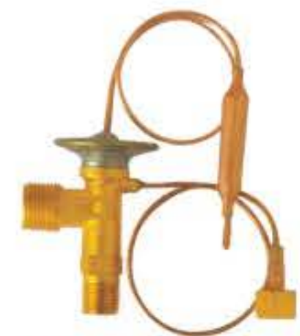
RG-58101 车型：丰田 (TOYOTA) 入口：9/16-18UNF(φ7.6) 出口：3/4-18UNF(φ11.9) 平衡器：7/16-20UNF 配件：O型 制冷量：0.5T-2.5T