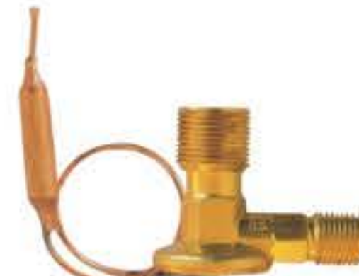
RG-58004-1 车型: 丰田 (TOYOTA) 入口: M16x1.5 出口: M22x1.5 配件: O型 制冷量: 0.5T-2.0T 91171919