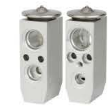
RG-58506 RCH6272 雪佛兰罗米娜 CHEVROLET LUMINA 92117402