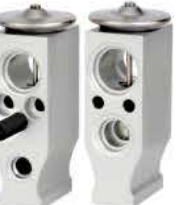
RG-58540 RCH6397 雪佛兰/乐风 CHEVROLET 9043403