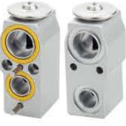
RG-58575 RCH7000 美国通用 GM 31404339