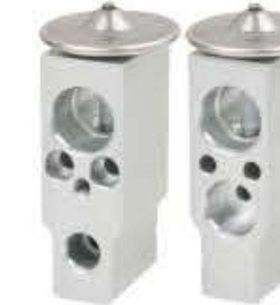
RG-58251 RCH6427 三菱SAVRIN/ 菱绅 MITSUBISHI SAVRIN 6F25 J1750-020