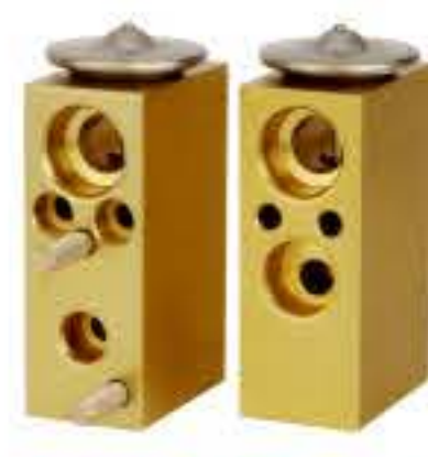
RG-58802 RCH6246-1 标致306 PEUGEOT 306 F-46723617D