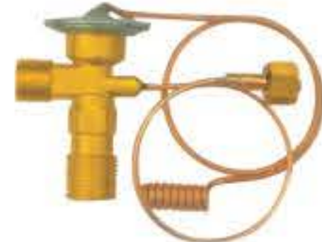
RG-58140 车型: 马自达 (MAZDA) 入口: 5/8-18UNF 出口: 3/4-16UNF 平衡器: 7/16-20UNF 配件: O型 制冷量: 0.5T-2.5T