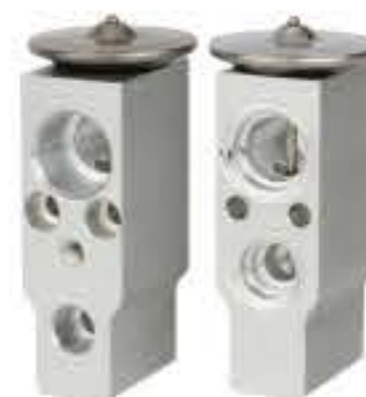
RG-58208 RCH6210 五十铃 G510 ISUZU G510 92100921