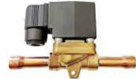
RG-5908 额定电压：DC24V 工作介质：R22/R134a/R410A/ R507/407C 最高工作压力：4.5MPa