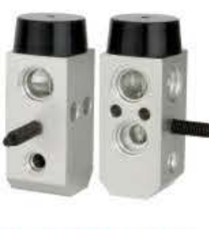
RG-58409 RCH6224 现代 HYUNDAI F108-CB5DA-02