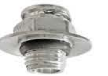
RG-10007 君越、君威 WT/UD IS626661