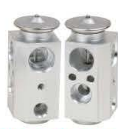
RG-58454 RCH6416 长安悦翔 CHANGAN ALSVIN H001650Z1601