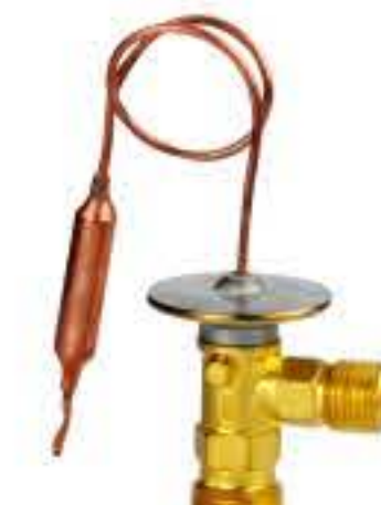
RG-58022 车型: 东南得利卡,尼桑 (NISSAN) 入口: M16x1.5 出口: M20x1.5 配件: O型 制冷量: 0.5T-2.0T OE:9200-D0101