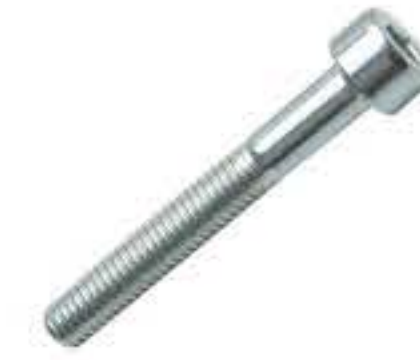
RG-10# 内六角M5*1.0 长度35MM(镀白)