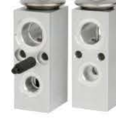
RG-58536 RCH6354 悍马3 HUMMER3 19120829