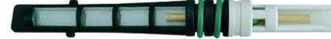
RG-68005 Color:Darkgreen Dia: 0.052