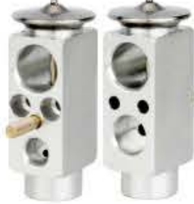
RG-58541 RCH6402 北京吉普 BEIJING JEEP 560253AH