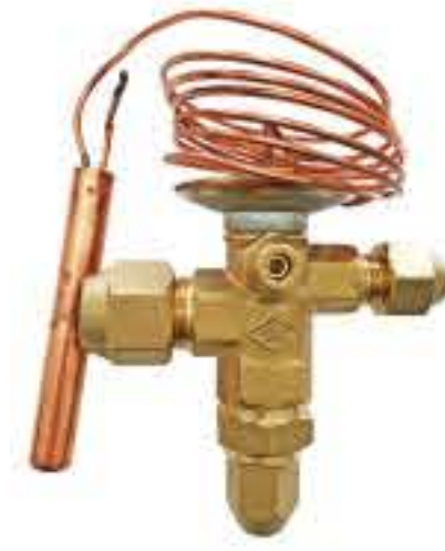
RG-5903 制冷剂：R22 名义容量：17.60Kw 蒸发温度范围：-40℃~+10℃