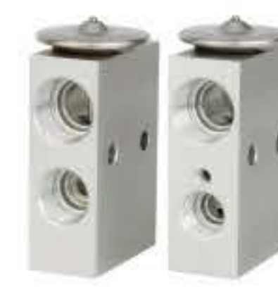
RG-58859 RCH6520 陕汽斯太尔 重汽豪沃(HOWO) 55036188