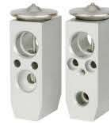
RG-58856 RCH6513 小松-7挖机 KOMATSU-7 1001738210