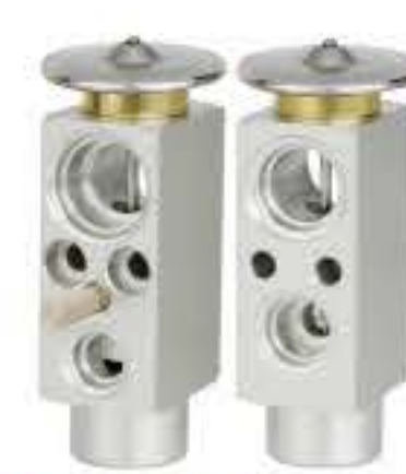
RG-58700 RCH6220 奔驰140 BENZ 140 1408300484