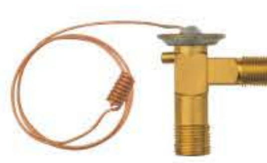
RG-58035 车型: 入口: 3/4-16UNF 出口: 5/8-18UNF 配件: F型 制冷量: 0.5T-2.0T