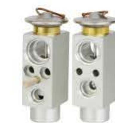
RG-58873 RCH6534 红岩杰狮 GENLYON/JMC 90487735