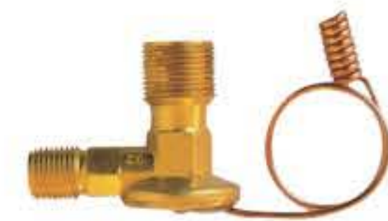
RG-58004 车型: 丰田 (TOYOTA) 134a 入口: M16x1.5 出口: M22x1.5 配件: O型 制冷量: 0.5T-2.0T 91171919