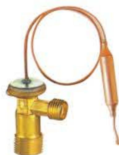
RG-58011 车型: 丰田 (TOYOTA) 入口: 3/4-16UNF 出口: 9/16-18UNF 配件: O型 制冷量: 0.5T-2.0T