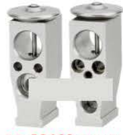
RG-58468 RCH6483 长安睿行M80 CHANG' AN M80 8100120-AT01