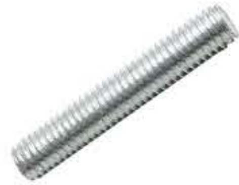
RG-2# M8*1.25 长度44MM(镀白)