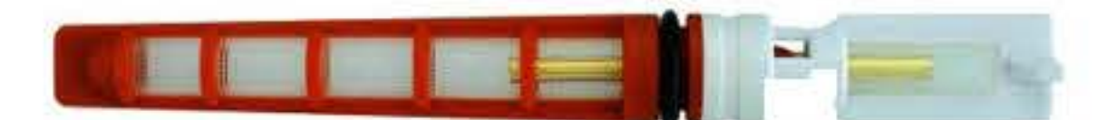
RG-68012 GEO Orange Condenser (0.72") Dia: 0.057