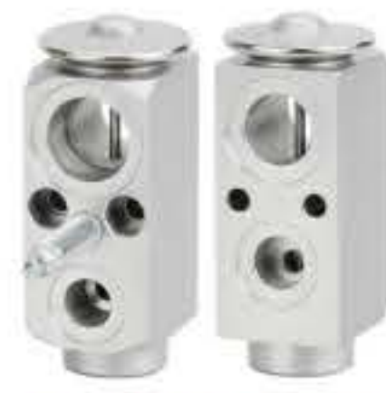
RG-58565 RCH6487 美国吉普 AMERICAN JEEP 68164490AA