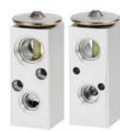
RG-58567 RCH6489 05款景程 05 JING CHENG 613521