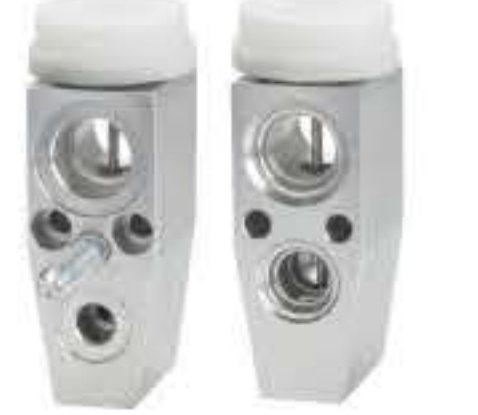
RG-58561 RCH6466 HB赛欧3 HB SAIL 3 90923291