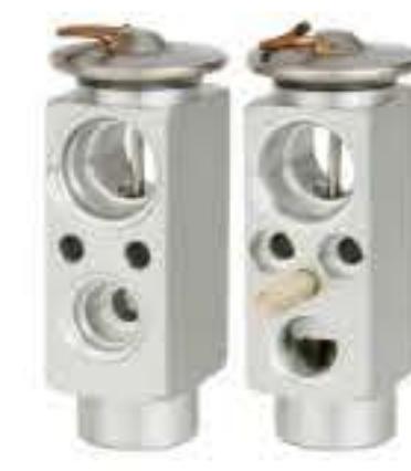
RG-58707 RCH6323 奔驰203 BENZ 203 2038300184