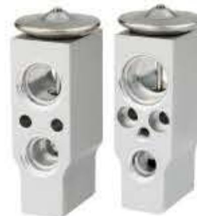
RG-58240 RCH6393 泰国奔驰 BENZ 1408300484