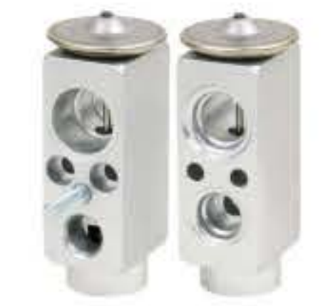
RG-58734 RCH6324-2 奔驰203.220 BENZ 203.220 220 830 0384