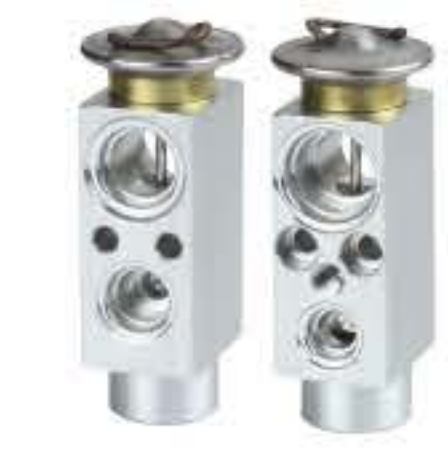
RG-58461 RCH6455 依维柯 宝迪前置 IVECO 51515-Q4614