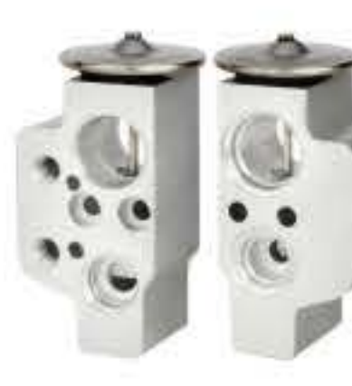
RG-58710 RCH6319 大众途锐 V.W TOUAREG 7L0820679A