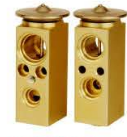
RG-58513 RCH6233 别克赛欧(老款) BUICK SAIL 601229W 1890319