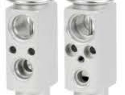
RG-58752 RCH6486 奔驰 BENZ N8153002