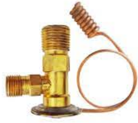
RG-58001-1 车型: 丰田 (TOYOTA) 入口: 9/16-18UNF 出口: 3/4-16UNF 配件: O型 制冷量: 0.5T-2.0T 88515-16040