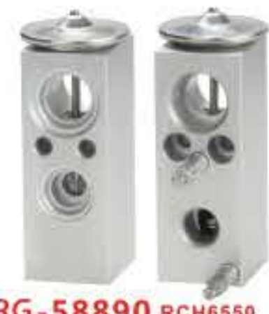
RG-58890 RCH6550 新款天龙/派恩 DONGFENG KINLAND-NEW/ PANINCO 555-136D