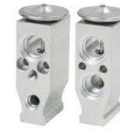
RG-58462 RCH6420 依维柯都灵V IVECO 51515-D16H