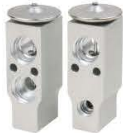
RG-58228 RCH6279 马自达6(老款) MAZDA 6 5261J14A