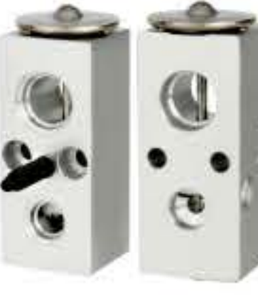
RG-58528 RCH6358 克莱斯勒 CHRYSLER 55055773AI