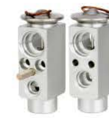
RG-58863 RCH6525 东风天龙 DONGFENG TANLONG 8106Z45-016