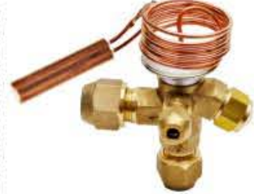
RG-5911 制冷剂：R134a NEW 阀芯规格：3# 名义容量：1.8-10.5Kw 5/8UNF 蒸发温度范围：-30℃~+10℃