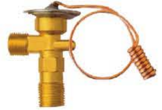
RG-58017 车型: 尼桑 (NISSAN) 入口: M20x1.5 出口: M16x1.5 配件: O型 制冷量: 0.5T-2.0T