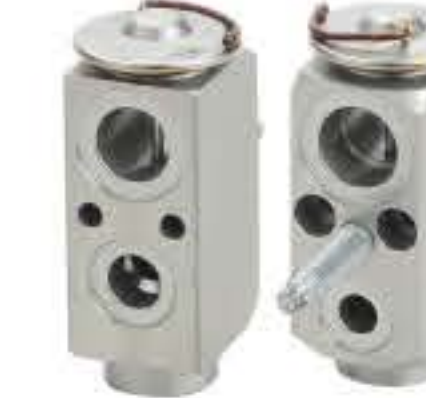
RG-58570 RCH6500 雪佛兰开拓者(进口) CHEVROLET TRAILBLAZER F8695002