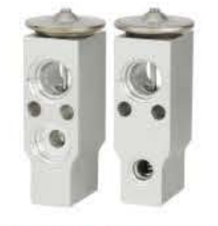
RG-58517 RCH6356 G18 别克商务车 GL8 BUICK BPV 9730595