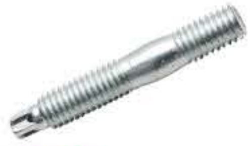
RG-1# 梅花头双头螺/M8*1.25 长度51MM(镀白)