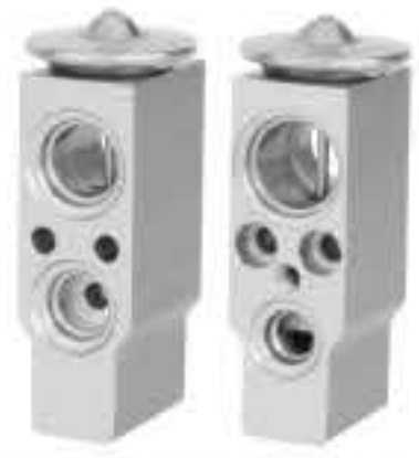
RG-58800 RCH6226 标致405 PEUGEOT 405 A1688300284