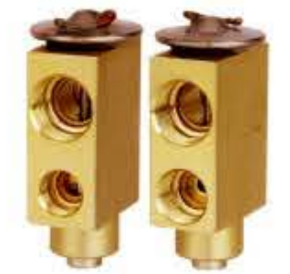
RG-58706 RCH6321 奔驰126 BENZ 126 830 0384