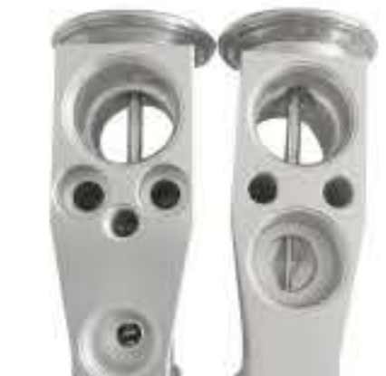
RG-58483 RCH7007 国产微车 CHINESE MINICAR