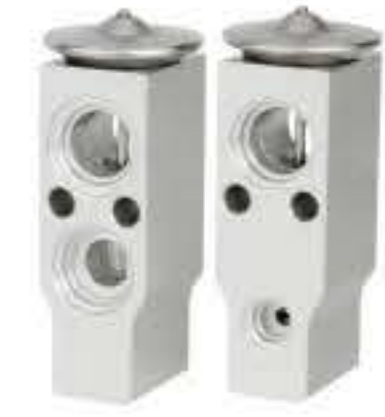
RG-58885 RCH6545 现代215-7挖机 HYUNDAI 215-7 0K08A61E13