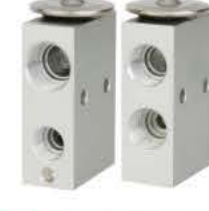
RG-58545 RCH6368 肯沃斯 KENWORTH 55055773A1