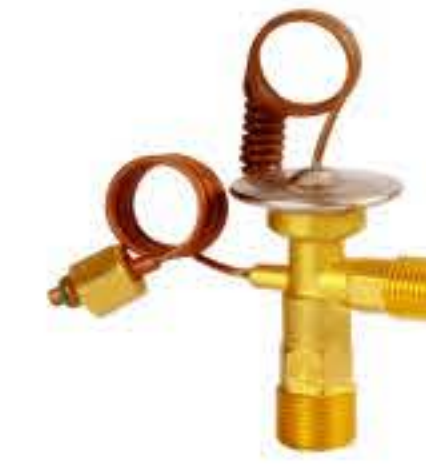
RG-58114 车型：马自达 (MAZDA) 入口：3/4-16UNF 出口：5/8-18UNF 平衡器：7/16-20UNF 配件：O型 制冷量：0.5T-2.5T OE:P-34-118