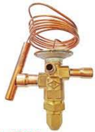
RG-5905 制冷剂：R22 名义容量：21.12Kw 1/2*5/8*1/4 蒸发温度范围：-40℃~+10℃