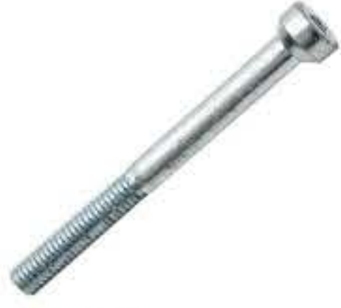
RG-6# 斜角内六角M5*1.0 长度50MM(镀白)