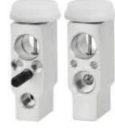
RG-58564 RCH6480 泰国福特 FORD RANGER UC9M61J14