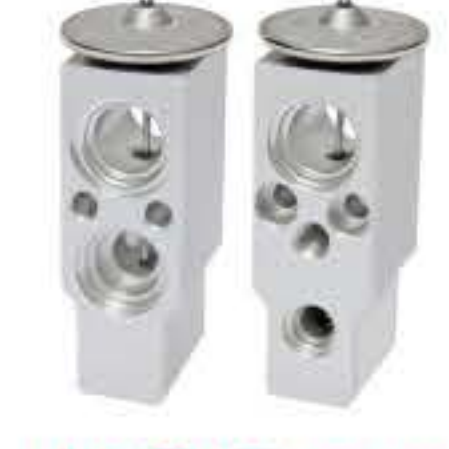
RG-58455 RCH6332 金杯、锐驰 JINBEI RUICHI H510M7Y1016