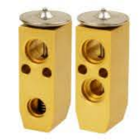
RG-58459 RCH6440 新款小红旗 NEW HONGQI G160215H