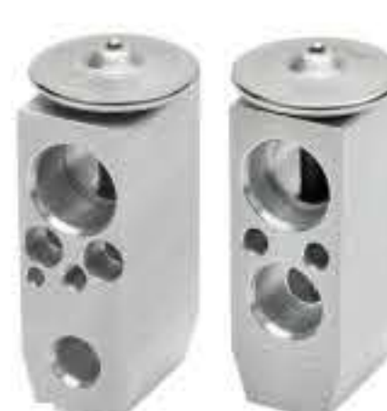
RG-58489 RCH-7029 华晨金杯F30 0834N08062 NEW