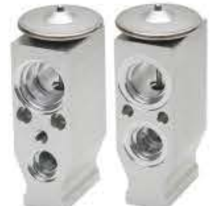
RG-58910 RCH-6570 定制产品