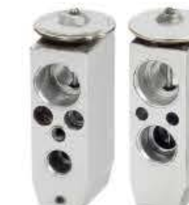
RG-58904 RCH6564 大运R134 DAYUN AUTO R134 8107DY03000