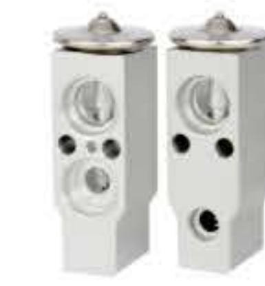
RG-58858 RCH6518 陕汽德龙F3000 SHAANXI DELONG F3000 447500-3100