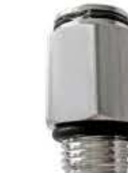
RG-10006 别克、君越 WA/GL8/UD 24236555