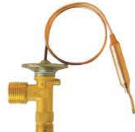
RG-58008 车型: 马自达 (MAZDA) 入口: 5/8-18UNF 出口: 3/4-16UNF 配件: O型 制冷量: 0.5T-2.0T