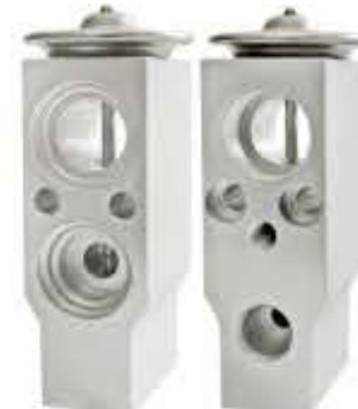
RG-58485 RCH7010 东南DX3 SOUFAST DX7