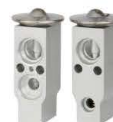
RG-58202 RCH6202 丰田R134a TOYOTA R134A 447500-9052