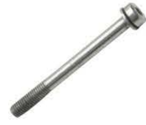
RG-7# 内六角M5*1.0 长度52MM(镀白)