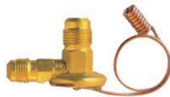
RG-58003 车型: 丰田 (TOYOTA) 入口: 5/8-18UNF 出口: 3/4-16UNF 配件: F型 制冷量: 0.5T-2.0T