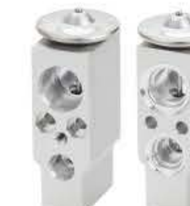
RG-58903 RCH6563 解放 JH6 JH6 8107JH06-010