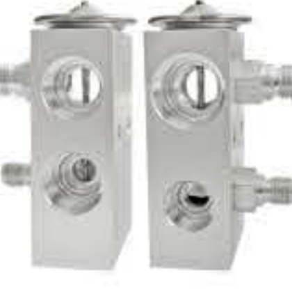
RG-58560-1 RCH6452-1 肯沃斯 KENWORTH 540446