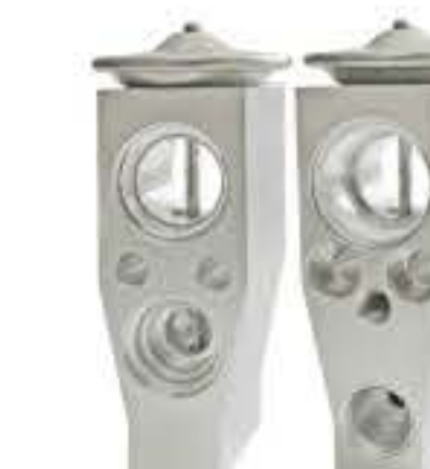
RG-58256 RCH7006 三菱欧蓝德(新款) MITSUBISHI OUTLANDER CSA3878009