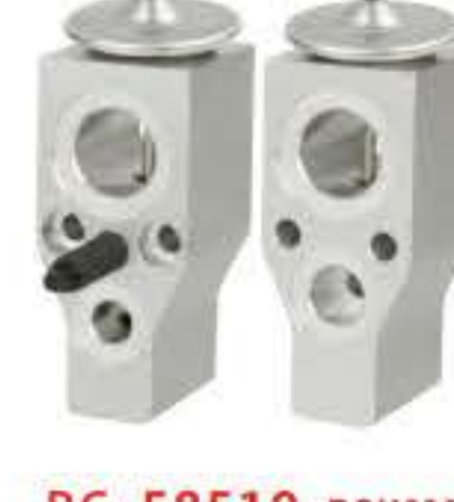
RG-58519 RCH6361 雪佛兰 CHEVROLET 10364923