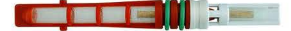
RG-68006 Color:Red For:Ford Dia: 0.057 福特翼龙 03-07 F5DZ-19D990-AB