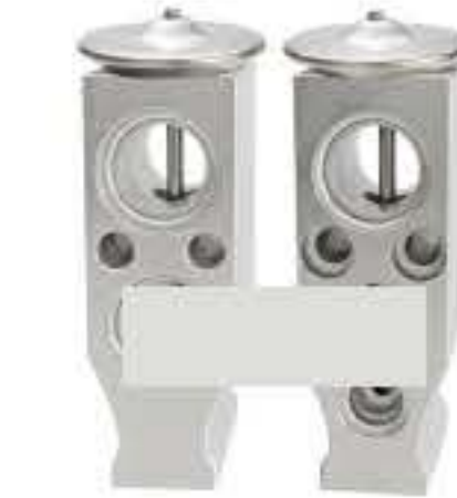
RG-58467 RCH6477 江铃驭胜 A205 830 8400