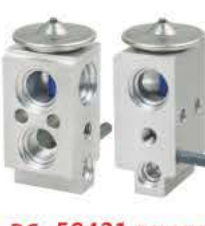
RG-58421 RCH6439 现代名图 HYUNDAI MISTAR 97626-3R000