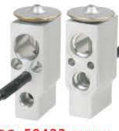
RG-58422 RCH6444 双龙STAVIC2.7A3 SSANG YONG STAVIC2.7A3 K011900008