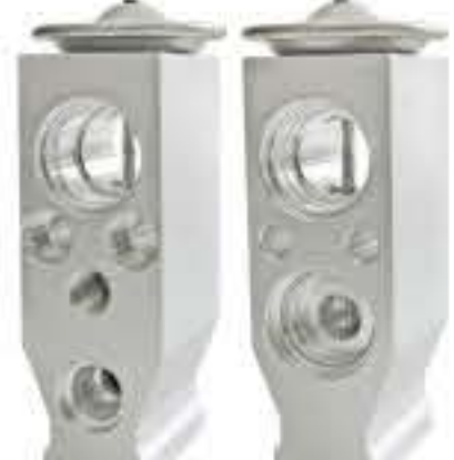
RG-58482 RCH7009 江铃驱胜N350.S350 F108FH9AA01