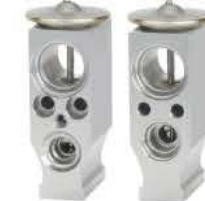
RG-58816 RCH6471 标致 307/308新BX3 PEUGEOT 307/308 BX3 W7497001