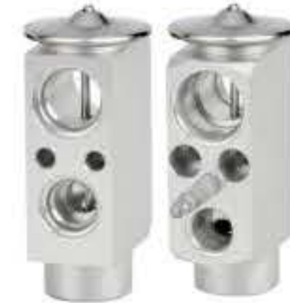
RG-58754 RCH6493 奔驰唯雅诺 BENZ 639 830 0384