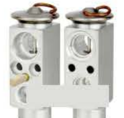
RG-58719 RCH6324 奔驰 203/211 BENZ 203/211 1718300184