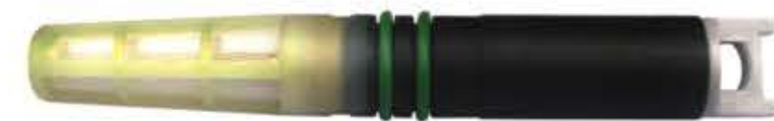
RG-68026 Color:Grey Porous For:GM Dia:0.062