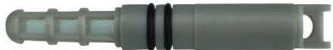
RG-68025 Color:Grey Porous For:GM 别克 Dia:0.062