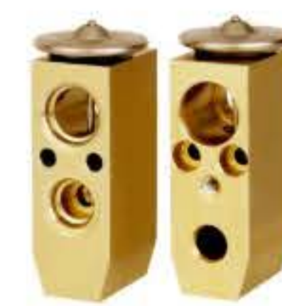
RG-58253 RCH6213-2 日产阳光 NISSAN SUNNY 92200-BY216