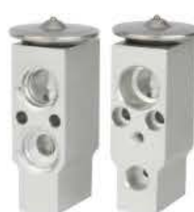
RG-58234 RCH6371 三菱TRITON MITSUBISHI TRITON 37410-G510