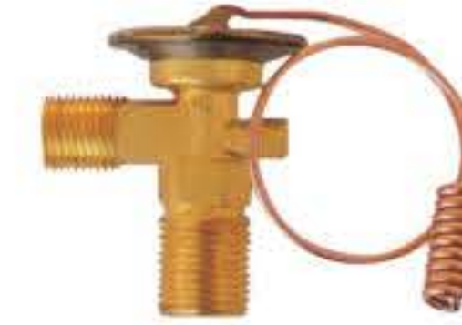
RG-58015 车型: 通用 (GM) 入口: 3/4-16UNF 出口: 5/8-18UNF 配件: O型 制冷量: 0.5T-2.0T