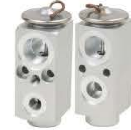
RG-58548 RCH6415 欧宝威达C/B2.0 OPEL 25994366