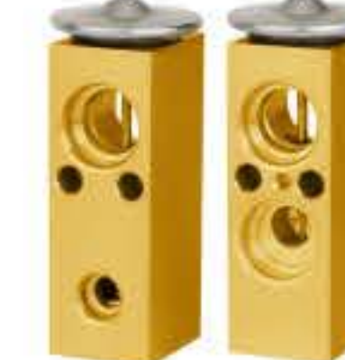
RG-58220-1 RCH6240-1 丰田R134a TOYOTA R134a