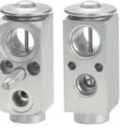
RG-58562 RCH6468 昂科雷后置 ENCLAVE 327505T