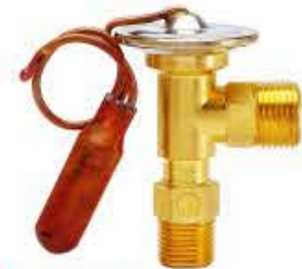
RG-58043 车型：福特 (FORD) 入口：5/8-18UNF 出口：3/4-16UNF 配件：O型 制冷量：0.5T-2.0T 2L 2Z19849CA