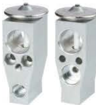
RG-58254 RCH6453 丰田新卡罗拉ALTIS TOYOTA COROLLA(NEW)ALTIS 447500-4790