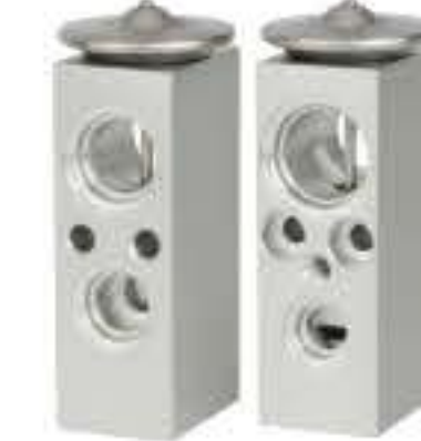
RG-58705 RCH6315 梅赛德斯W201 MERCEDES W201 2018300784