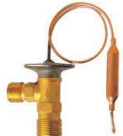
RG-58021 车型: 入口: 3/4-16UNF 出口: 9/16-18UNF 配件: O型 制冷量: 0.5T-2.0T