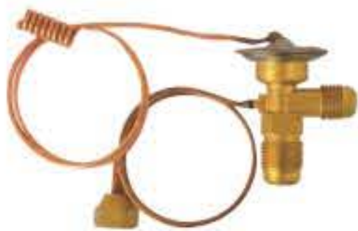
RG-58137 车型: 宝马 (BMW) 入口: 5/8-18UNF 出口: 3/4-16UNF 平衡器: 7/16-20UNF 配件: F型 制冷量: 0.5T-2.5T