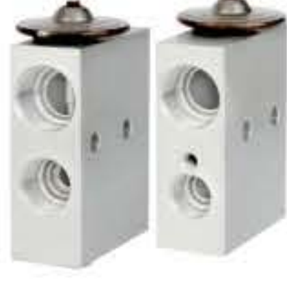
RG-58551 RCH6329 切诺基 CHEROKEE 50051BH