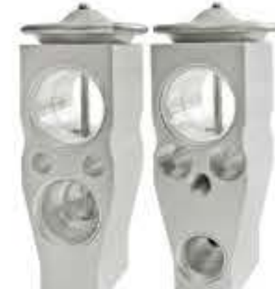
RG-58481 RCH7005 南京长安电动微车 ASCAJ40974