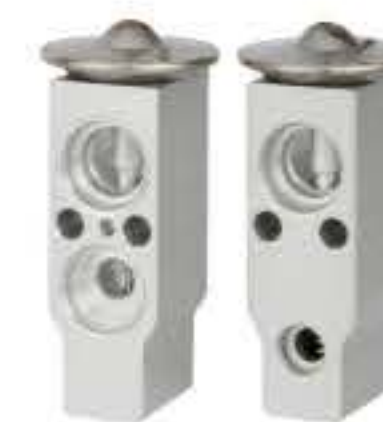
RG-58203 RCH6202-1 丰田R134a TOYOTA R134A 447500-0031