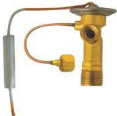
RG-58133 车型: 通用 (GM) 入口: M20X1.5 出口: M16X1.5 平衡器: M12X1.5 配件: O型 制冷量: 0.5T-2.5T