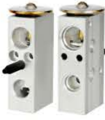
RG-58527 RCH6338 道奇 DODGE 5019218AA