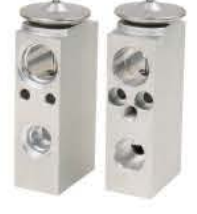
RG-58732 RCH6428 克莱斯勒 CHRYSLER 5136101AA/AB