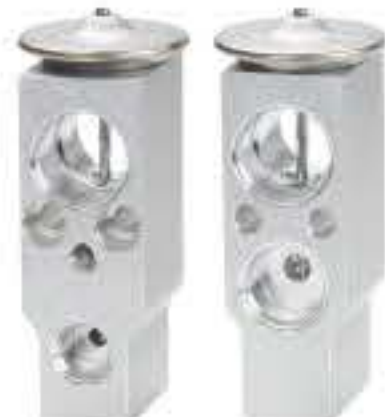
RG-58892 RCH6552 定制产品