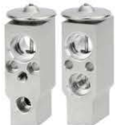
RG-58898 RCH6558 豪沃轻卡 HOWO LG1613822016 A:M8