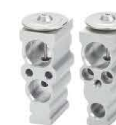
RG-58261 RCH6498 新款本田CRV HONDA CRV GZ447500-4930