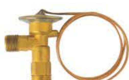
RG-58038 入口：3/4-16UNF 出口：5/8-18UNF 配件：O型 制冷量：0.5T-2.0T