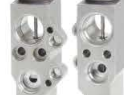
RG-58748 RCH6467 奥迪 A1 AUDI A1 1S0820679C