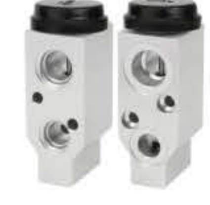
RG-58553 RCH6424 雪佛兰科帕奇 CHEVROLET CAPTIVA 615837C-100