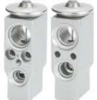
RG-58813 RCH6462 雪铁龙C3 CITROEN C3 6F668757W