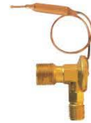
RG-58014 车型: 本田 HONDA 入口: M16x1.5 出口: M22x1.5 配件: O型 制冷量: 0.5T-2.0T OE:447500-1451 OE:80221-SOXA51