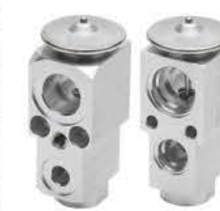
RG-58764 RCH-7024 宝马新款525/530i/740i 64119361710 NEW