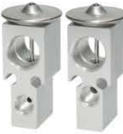
RG-58232 RCH6446 本田Brio HONDA BRIO 447500-4650