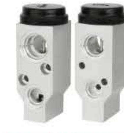
RG-58515 RCH6273 别克凯越 BUICK EXCELLE 95431-85Z00