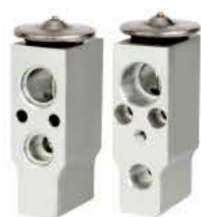
RG-58237 RCH6387 颐达/骊威/森林人/翼豹 TIIDA 503714-1650