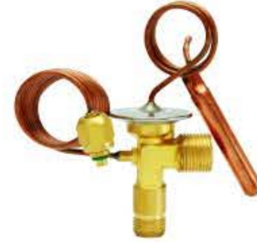
RG-58132 车型: 本田 (HONDA) 入口: 5/18-18UNF 出口: 3/4-16UNF 平衡器: 7/16-20UNF 配件: O型 制冷量: 0.5T-2.5T