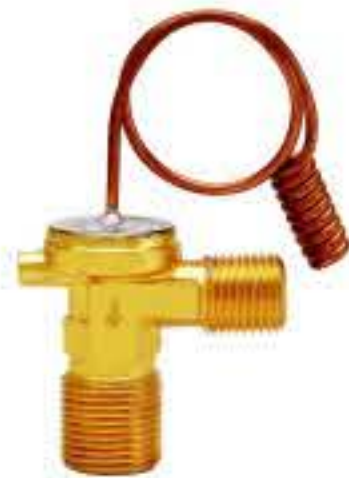
RG-58045 车型：通用 (GM) 入口：M16X1.5 出口：M20X1.5 配件：O型 制冷量：0.5T-2.0T