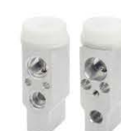
RG-58260 RCH6482 泰国铃木SX4 THAILAND SUZUKI Sx4 10QTEX-5