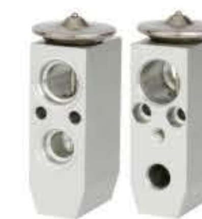
RG-58252 RCH6213-1 日产尼桑 NISSAN 92200-16H08