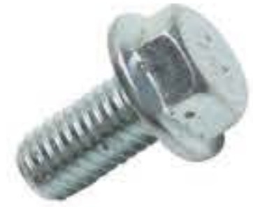
RG-11# 外六角法兰面M8*1.25 长度16MM(镀白)