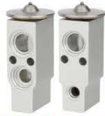
RG-58400 RCH6203 起亚 KIA 1K2A1-61-J11