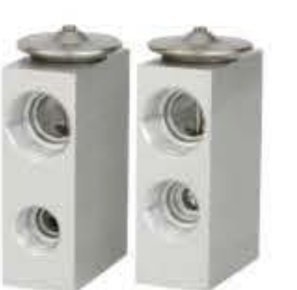
RG-58549 RCH6333 美国通用雪佛兰R134 CHEVROLET