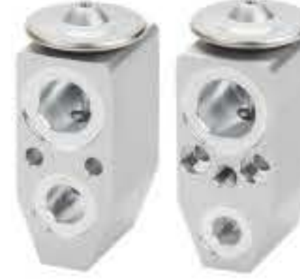
RG-58571 RCH6501 福特翼博 FORD ECOSPORT 52384190