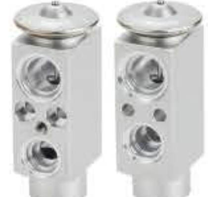
RG-58569 RCH6496 美国拖车 AMERICA TRAILER 3857948C2