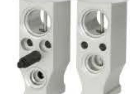
RG-58555 RCH6399 新款别克GL8后置/景程 NEW BUICK GL8 REAR/EPICA 93733230