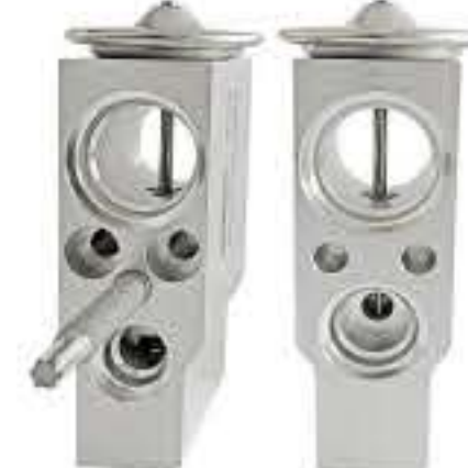
RG-58576 RCH7003 道奇酷威 DODGE JOURNEY AA447500-3450