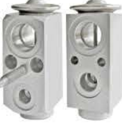
RG-58757 RCH7014 奔驰GL C253/C205/C213 BENZ A0998300100