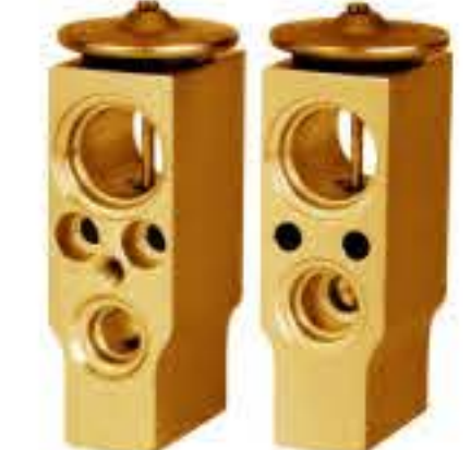
RG-58814 RCH6462-1 标致307/308/807 PEUGEOT307/308/807 68019148AA