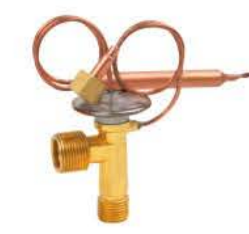
RG-58115-1 车型：尼桑 (NISSAN) 入口：M16X1.5 出口：M20X1.5 平衡器：M12X1.25 配件：O型 制冷量：0.5T-2.5T